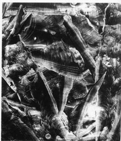
Komposition, 1968 Mischtechnik/Papier 64x60cm