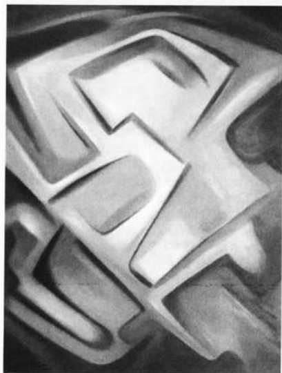
Komposition, 1972 Öl/Pappe 80x60cm

Klühspies ging es nach seinen eigenen Worten in erster Linie um „das Schwingen einer universalen Harmonie“, um „reine Malerei“, die „eine Art der Musik“ sei. Dies läge „im Auf- und Abklingen der Farben sowie im Rhythmus und im Schwingen der Linien“ begründet, und (so möchte man hinzufügen) im Rhythmus und der Komposition der Farben.