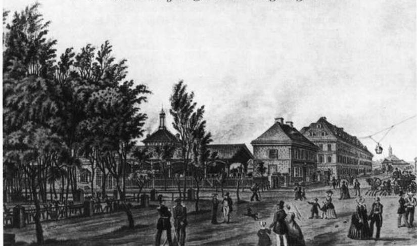
Abb. 4: Der Fürther Bahnhof 1848

verbilligte nicht nur den Kohlepreis. Weil die letztlich verwendeten Kronacher Steinkohlen über einen hohen Schwefelgehalt verfügten und entschwefelt werden mussten, entstand 1847 Bayerns erste Gasanstalt.