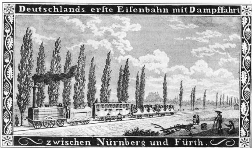
Abb. 2: Werbeprospekt der Nürnberger Tabakfabrik Platner für die Ludwigs-Eisenbahn

Jetzt, da die Bahn lief, konnten Aktionäre, Techniker und das Publikum sich ganz der technischen Innovation widmen, der „pfeilschnellen Dampfzelle“, dem „gleich einer Windsbraut fliegenden Feenzug“, der den bezeichnenden Namen „der Adler“ erhalten hatte. Auch die aus England importierte