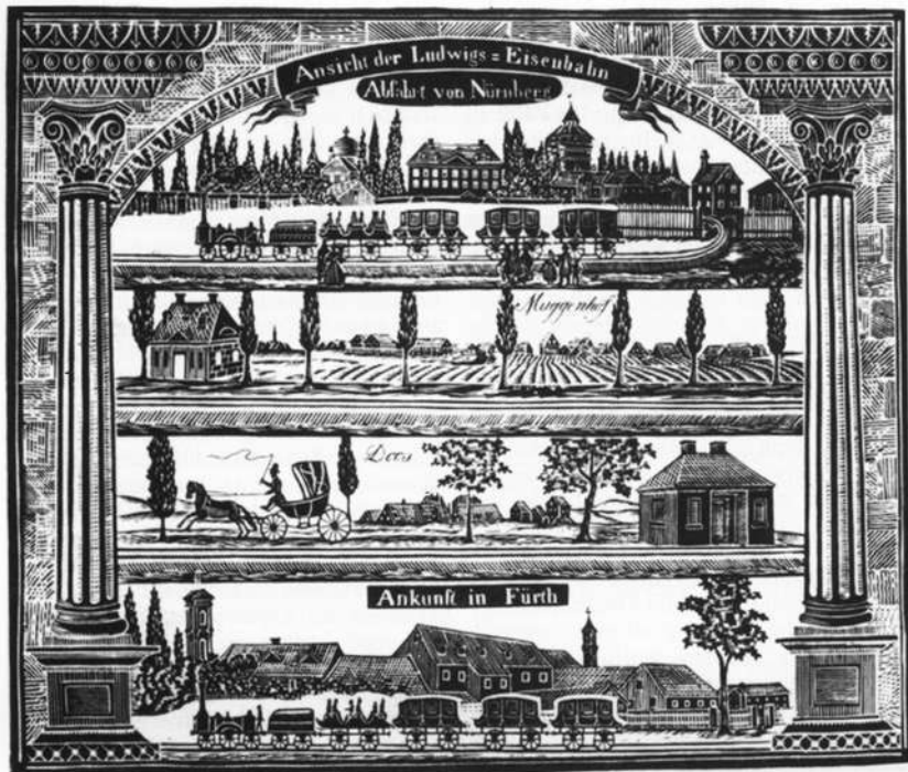
Abb. 5: Die Reiselandschaft zwischen Nürnberg und Fürth als Panorama (Holzschnitt)

In den im September 1836 erlassenen „Fundamental-Bestimmungen für sämtlichen Eisenbahn-Statuten in Bayern“ waren mehrere Anordnungen enthalten, die seine Anregungen (Mindesttragkraft der Schienen, Spurweite, bevorzugte Verwendung der Dampfkraft) aufgriffen und die privaten Gesellschaften zur Beachtung verpflichteten.