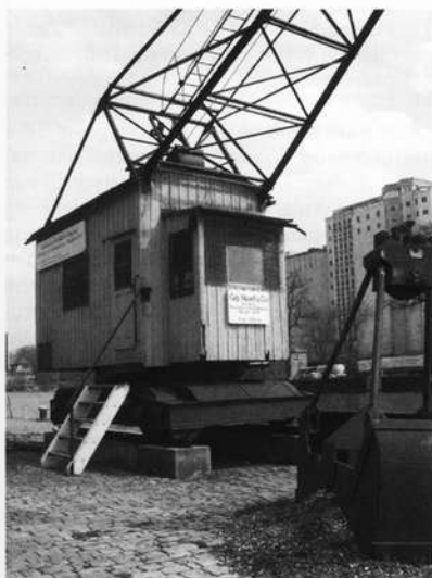
Greiferdrehkran von 1926

Eine sehr wichtige Rolle bei der Vermittlung industriegeschichtlicher Inhalte spielt die museumspädagogische Arbeit des Museums-Service, kurz MuSe genannt. Unter den vielen Programmen und Projekten möchte ich nur die Erarbeitung eines von einem Prospekt begleiteten Rundweges unter dem Titel „Fluss und Fleiß“ anführen, der gemeinsam mit dem Arbeitskreis Industriekultur (abgekürzt AKI) erstellt wurde.