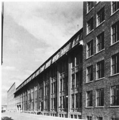
Zerstörung und Wiederaufbau bei Fichtel&Sachs