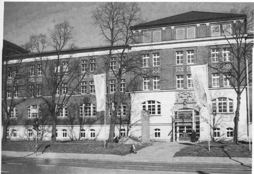
Das Hauptgebäude der ehemaligen Hindenburg-Kaserne ist nun das zentrale Hörsaalgebäude der Fachhochschule Ansbach.