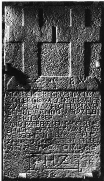
Abb. 1. Das durch zwei lateinische Kreuze für Eheleute verzierte Epitaph, 1597/1600, vom Friedhof der Wüstung Grubingen, jetzt im Pfarrhof zu Röllfeld am Main.

Das verfallende Friedhofsgemäuer der Wüstung Grubingen wurde in den Jahren 1976 bis 1979 gründlich restauriert und wiederhergestellt 1) . Bis zur Restaurierung staken in dem Mauerwerk innen einige historische Grabsteine aus einer Zeit, da diese Anlage noch den Menschen in Röllfeld als Friedhof diente. Zu diesen historischen Denkmalen zählt auch ein Monument, dessen untere Schmalseite ebenfalls auf Sicht gearbeitet ist, es ist dort nichts abgebrochen! Demnach diente dieses Monument einst nicht als Grabstein sondern es war ein Epitaph (Abbildung 1), das man an einer Mauer oder an einer Wand befestigte. Nach meiner Kenntnis ist es das einzige durch zwei Kreuze verzierte Kreuzepitaph 2) . Zu seinem Schutz wurde es anlässlich der erwähnten Instandsetzung/Renovierung des ehemaligen Grubinger Friedhofs gereinigt, nach Röllfeld verbracht und im dortigen Pfarrhof neu aufgestellt. Da der Stein nun nicht mehr vermoost ist, kann man seine Inschrift gut lesen; sie ist in Kapitalis eingehauen. Ligaturen sind hier durch Unterstreichen gekennzeichnet. Die Inschrift lautet: