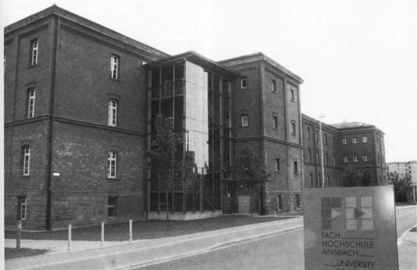
Hörsaalgebäude der Fachhochschule Ansbach.