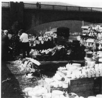
Abb 7: „Häfelesmarkt“ der Michaelismesse 1932

sowohl mit der Bahn als auch mit dem immer stärker werdenden Autoverkehr. Als zusätzliche Attraktion belebte der Gewerbeverein 1928 die frühere Messe wieder, die heute Ende August/Anfang September veranstaltet wird und sich zum größten Volksfest am bayerischen Untermain entwickelt hat. Die gelungene Synthese von Festzelt, Fahrgeschäften, Handwerksmesse und traditionellen Verkaufsständen, die unmittelbare Anbindung des Festgeländes an die Altstadt zieht alljährlich zahlreiche Besucher aus Nah und Fern an.