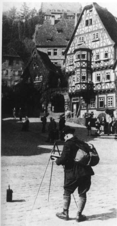
Abb. 6: Touristen am Marktplatz 1937