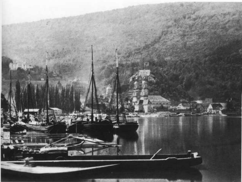
Abb. 4: Schiffe, Steinhauer- und Holzplätze am Mainufer um 1875.

Obwohl sich die Miltenberger Spediteure und Kaufleute von Anfang an energisch und ideenreich für eine Verbesserung der Verkehrssituation einsetzten, fanden sie dafür weder in Würzburg noch in München Gehör. Die Stadt und ihre wirtschaftliche Führungs-