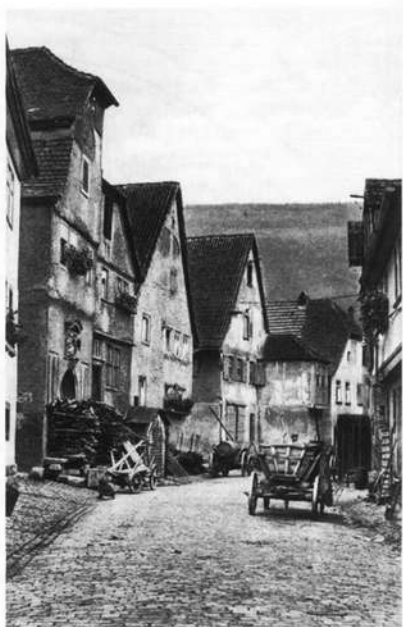
Abb. 3: Kleinbäuerliche Anwesen in der Riesengasse

Bis zum Beginn des 18. Jahrhunderts versing kaum ein Jahrzehnt ohne zusätzliche Belastungen durch militärische Durchzüge und Einquartierungen. Entsprechend langsam erholte sich das Gemeinwesen. Durch