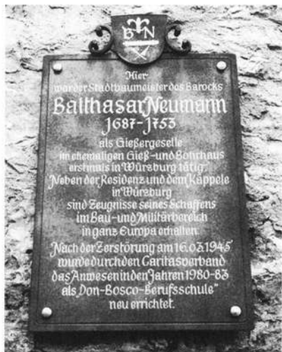
Gedenktafel am einstigen Gießhaus am Schottenanger im Würzburger Mainviertel.