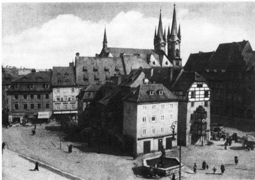
Eger um 1940. Marktplatz mit dem Stöckl, im Hintergrund die St. Niklas-Kirche, in der Balthasar Neumann getauft worden ist.

ren kamen, sondern gut 800 Jahre früher. Sie kamen auch nicht als Besetzer und Eindringlinge, sondern auf Einladung der Přemysliden-Herzöge und -Könige, die ihre Herrschaft vom 12.–Anfang des 14. Jahrhunderts ausübten. Die Einwanderer kamen als Kaufleute und Geistliche, später als Bauern, Handwerker und Bergleute und besiedelten die Randgebiete.