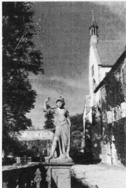
Klosterkirche und Prälatenbau

Als der Heilige Bernhard von Clairvaux auf seiner Pilgerreise auch in Wertheim weilte, zeigte er eines Tages nach einer Wildnis des Taubertals und sprach: "Auch dort wird ein Kloster meines Ordens gegründet werden". Diese Weissagung des berühmten Abtes ging noch zu seinen Lebzeiten in Erfüllung. Einige fränkische Edelleute hatten nämlich beschlossen ein Zisterzienserkloster zu stiften, und als sie dafür in dem stillen anmutigen Taubertale einen Platz suchten, flogen plötzlich aus jener Gegend drei weiße Lerchen, ihr fröhliches Morgenlied singend, in die heiteren Lüfte empor. In dieser außerordentlichen Erscheinung erblickten die adeligen Herren einen Fingerzeig Gottes und bauten an der bezeichneten Stelle die Abtei Bronnbach. Diese nahm in ihr Wappen eine der Lerchen