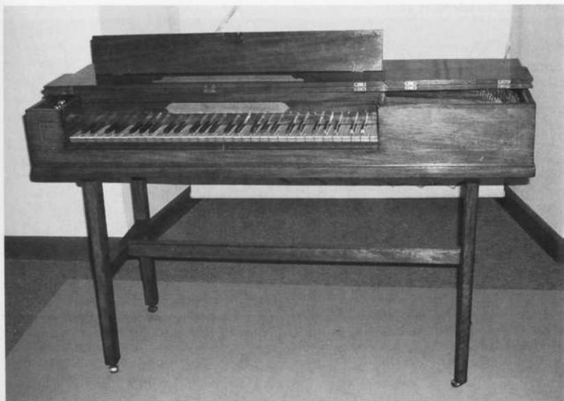
Tafelklavier von Fredericus Beck, London um 1772. Sammlung Michael Günther, Schloß Homburg am Main, Inventar-Nr. 8.

Es verwundert, daß Zumpe sein Instrument nicht patentieren ließ. Vielleicht ist der Grund darin zu suchen, daß er sich nicht als den eigentlichen geistigen Vater dieser Instrumente betrachtete.