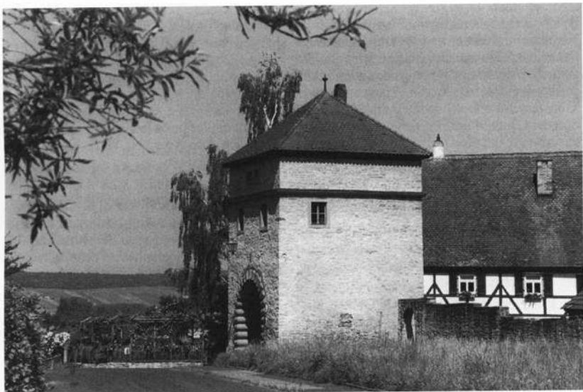
Zur alten Sommeracher Dorfwehr gehört das Maintor