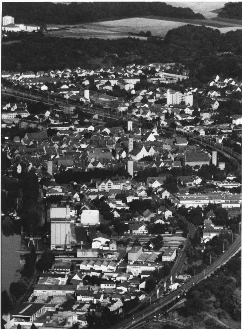
Abb. 2 Das Ochsenfurter Aligement der Türme, Aufnahme vom Motordrachen aus in ca. 400 Meter Höhe. In einer Linie stehen von vorne nach hinten: das Klingentor, der Kirchturm von St Andreas und das Obere Tor. Die auf dem Luftbild heute sichtbare Abweichung der Turmspitzen und Turmknäufe von der Grundlinie hat ihre Ursache im schiefen Turm von St. Andreas; schief ist allerdings nur die hölzerne Konstruktion der Turmspitze, nicht jedoch der steinerne Turm.