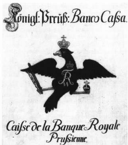
Firmenschild der „Königl. Preuß. Banco Cassa“

In der Vorgeschichte müssen wir auf das Jahr 1757 zurückgreifen: Nach dem Tode seines Vaters, des Markgrafen Carl Friedrich Wilhelm, genannt „der wilde Markgraf“, trat der junge, 1735 geborene Christian Alexander in Ansbach sein überschuldetes Erbe an. Er leitete sofort rigorose Sparmaßnahmen ein, die vor allem das höfische Leben betrafen; doch mußte er alsbald erkennen, daß er dabei nicht die erhoffte Unterstützung seines Hofstaates fand.