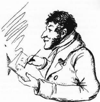
Hoffmann, Selbstporträt, 1808/13