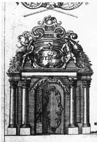
Abb. 7: Das alte Barockportal bis 1894. Den von Hecken begrenzten Irrhain betrat man durch ein abschließbares Portal, das die Inschrift Irr-Wald trug. Je ein Säulenpaar schmückte das Portal zu beiden Seiten. Die Aufsatzkartusche darüber wurde flankiert von den Schäfern Damon und Philemon, neben denen sich aus Füllhörnern ein reicher Blumenschmuck ergoß (Perspektivischer Grundriß und PROSPECT, des weit berühmten NÜRNBERGISCHEN IRRGARTENS bey Kraftshoff zu finden bey Christoph Rigel, Buch- u. Kunsthändler in Nürnberg unter der Vesten).

Ende der 1970er Jahre hatten Pläne für eine Restaurierung und Teilrekonstruktion das Interesse der Öffentlichkeit wieder in stärkerem Maße auf den Irrhain gelenkt. Ein vom Gartenbauramt entworfener Grundrißplan sah vor, in rund einem Fünftel des 14 000 Quadratmeter großen Areals den Schlangengang und die Lange Allee mit sieben Laubhütten originalgetreu wieder entstehen zu lassen. Eine kleine Bühne sollte dem Pegnesischen Blumenorden Aufführungen ermöglichen. Selbst die finanzielle Frage war weitgehend gelöst.