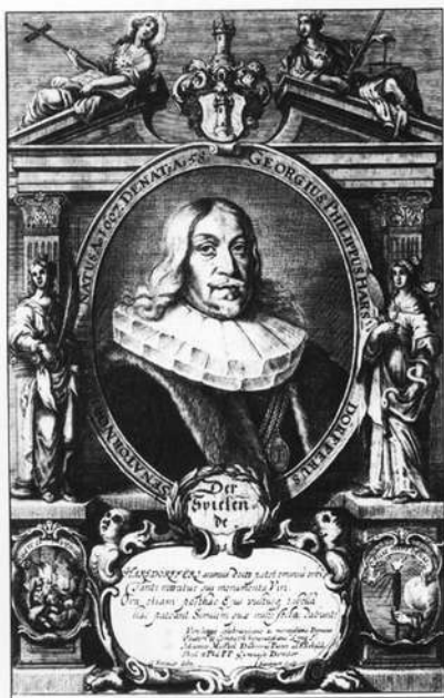
Abb. 2: Georg Philipp Harsdörffer, der Stifter und erste Präses des Pegnesischen Blumenordens (1607–1658). Zusammen mit Johann Klaj, einem jungen Theologen und gekrönten Poeten, stiftete er 1644 den Blumenorden. Der aus einer angesehenen Nürnberger Patrizierfamilie stammende Harsdörffer gilt als einer der bedeutendsten Vertreter des literarischen Barocks (Georgius Philippus Harsdörfferus. Kupferstich, gezeichnet von Georg Strauch, gestochen von Jacob Sandrart.).