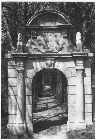
Abb. 8: Das neue Portal des Irrhains aus dem Jahr 1894. Das 250jährige Jubeljahr der Ordensgründung war Anlaß, an Stelle des altersschwachen, verfallenen Portals ein neues im Barockstil zu errichten. Die Aufsatzkartusche erhielt die Inschrift Irrhain mit der Jahreszahl 1676, dem Jahr, in dem Pfarrer Limburger den Irrwald anlegte. Die seitlich angefügten Jahreszahlen erinnern an die Ordensgründung 1644 und an die Renovierung des Irrhains 1894.