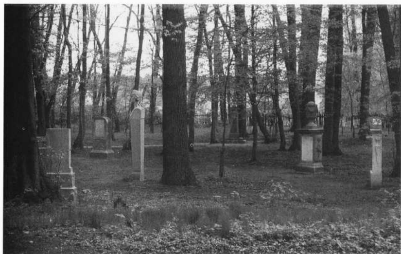
Abb.6: Der Irrhain 1983