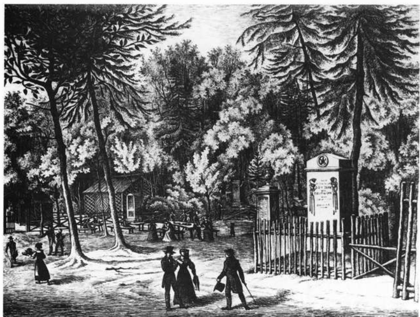
Abb.5: Der Irrhain 1844