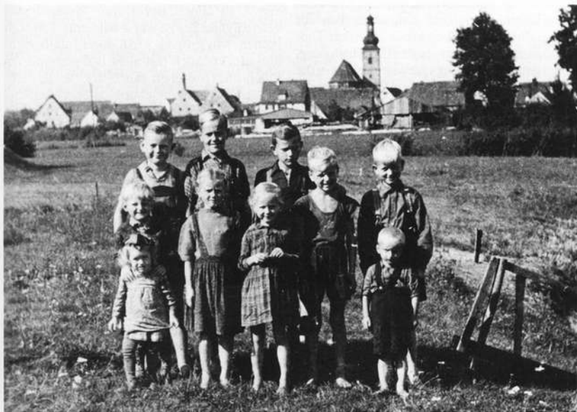
Kinder aus dem Flüchtlingslager in Frauenaaurach (Erlangen) um 1950

Vertriebenen – Überlebende der Flucht vor der Roten Armee sowie anfangs spontan, ab 1946 dann gezielt Ausgewiesene aus der Tschechoslowakei, aus Polen, Ungarn und Rumänien – die größte Herausforderung der Länderregierungen wie auch der ortsansässigen Bevölkerung in den Städten und Gemeinden in Rest-Deutschland (einschließlich der DDR) dar.