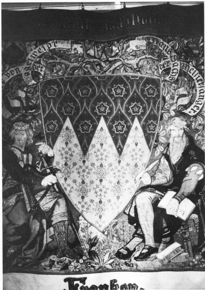
Das Bundesbanner 1862 des Fränkischen Sängerbundes mit Darstellungen von Walther von der Vogelweide (links) und Hans Sachs.