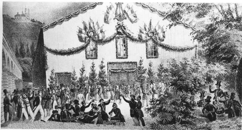
Eine zeitgenössische Lithographie zeigt das 1. Deutsche Sängerfest 1845 in Würzburg.

fränkischen Städte-Nachbarn an der Romanischen Straße wertvolle Dauerleihgaben zur Verfügung zu stellen.