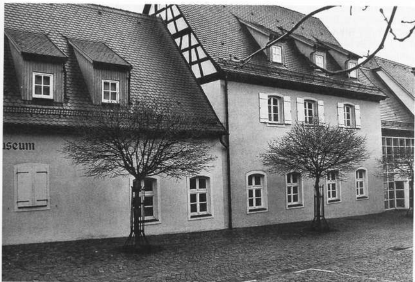
Ein reizvolles Ensemble bildet das Feuchtwanger Sängermuseum auf dem historischen Pflaster der Kreuzgangstadt.

1991 wurde das Sängermuseum des Fränkischen Sängerbundes durch Bayerns Kultus- minister Hans Zehetmair offiziell seiner