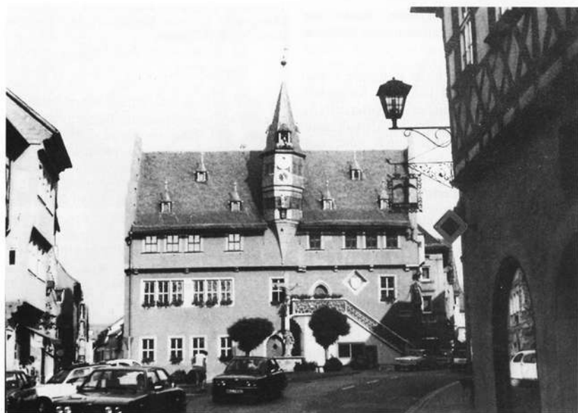
Das „Neue Rathaus“ mit dem Uhrtürmchen und dem unter der schönen Freitreppe befindlichen „Narrenhaus“.

Herausragendes Bauwerk der Stadt aber ist die St. Andreaskirche. Während der sechsgeschossige Turm noch aus romanischer Zeit