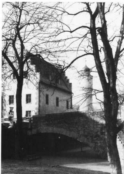
Alte Brücke mit dem sog. „Schlößchen“ und dem Stadtturm am Bollwerk.

Über die alte Mainbrücke (1512-1519), die durch die Sprengung des Jahres 1945 und später durch den Ausbau der Schifffahrtsstraße des Rhein-Main-Donau-Kanals mehrere Bögen und auch eine alte Statue des hl. Nepomuk verloren hat, kommen wir in die Alt-Stadt. Die beiden in Brückenkanzeln stehenden Figuren des hl. Nepomuk wurden in der Nachkriegszeit von den Bildhauern Willi Grimm und Willy Ax geschaffen. Auf der rechten Seite begrüßt uns ein rechteckiger,