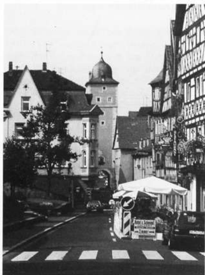
Fachwerkhäuser in der Hauptstraße, überragt von dem im Westen stehenden Klingentor.

den Bau eines Garagenhauses und von Parkplätzen, in der Erstellung eines Hochwasserschutzes, der Versorgung mit Fernwärme, im Bau von Sport- und Freizeiteinrichtungen, im Wirken und Leben zahlreicher Vereine und in den großen Siedlungsgebieten im Osten, Norden und Westen der Stadt widerspiegelt. Auch der Fremdenverkehr stellt im Wirtschaftsleben der Stadt einen nicht zu unterschätzenden Faktor dar. Das weitgehend erhaltene historische Stadtbild, die reiche Geschichte mit einzigartigen kulturellen Zeugnissen, wie der Ganzhorn'sche Bibliothek 10) , und Kunstschätzen und die vor allem zentrale Lage im fränkischen Weinland mit sehr günstigen Verkehrsanbindungen, machen Ochsenfurt zu einem Standort für Exkursionen, Wanderungen und Ausflüge und zieht viele Fremde an. Die Gastronomie bietet das Beste aus Küche und Keller und vermittelt dem Gast eine Atmosphäre anheimelnder Gemütlichkeit. Neben fränkischen Spezialitäten sind es auch internationale Gerichte, die auf den Speisekarten stehen. Die beiden großen Ochsenfurter Brauereien, Familien-