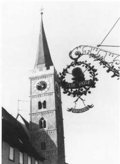
Der hochaufragende romanische Kirchturm der Stadtpfarrkirche St. Andreas.