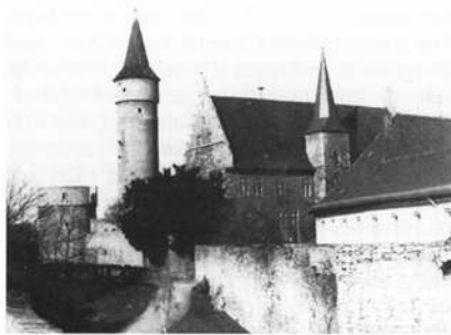
Das Palatium, Sitz der Domherren, mit Graben, Mauer und Türmen.

Im Gegensatz zu Kleinochsenfurt führt die Stadt nur einen halben Ochsen im Wappen. Zwei Sagen berichten, wie es dazu kam. Während die eine von einem aus der Furt steigenden Ochsen zu erzählen weiß, berichtet die andere von einem halben Ochsen, der bei einer Belagerung Ochsenfurts über die Stadtmauer geworfen worden sei, der den Feind von der Nutzlosigkeit einer weiteren Belagerung überzeugte.