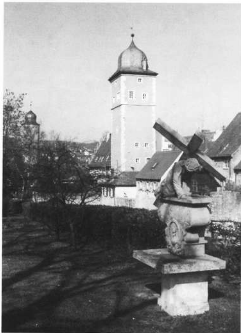
Schönes Stadtensemble mit Kreuzschlepper und Klingentor, in dem sich die Jugendherberge befindet.