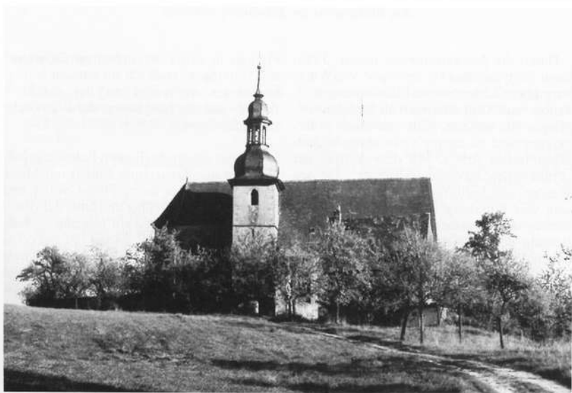
Die altehrwürdige Wallfahrtskapelle St. Wolfgang. Etwas unterhalb der Kapelle befindet sich die Brunnenstube des Wolfgangsprünleins.

Für einen Besuch in Ochsenfurt wird noch auf den offiziellen Führer der Stadt und die von Ostern bis Ende September stattfindenden Stadtführungen empfehlend hingewiesen. 18)