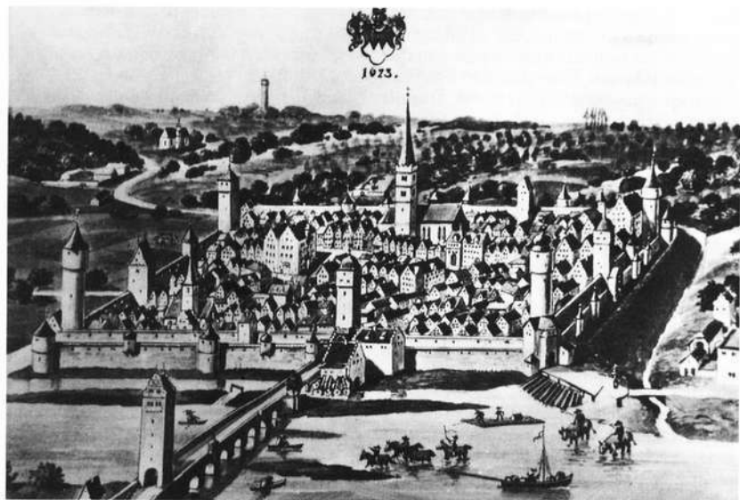
Stadtbild aus dem Jahre 1623. Von der historischen Substanz ist vieles bis auf die heutige Zeit erhalten geblieben.

ein Ochsenfurter Schmied, Hans Stock mit Namen, das Heer des letzten Staufers, König Konradin, der am 29. Oktober in Neapel hingerichtet worden war, sicher nach Deutschland zurückgeführt habe. Im Jahre 1291 wird Ochsenfurt in den Urkunden erstmals „oppidum“ (Stadt) genannt. Mit dem Verkauf der Stadt durch den Bischof Manegold von Neuenburg im Jahre 1295 an das Würzburger Domkapitel, das dann einen systematischen Auf- und Ausbau der Stadt betrieb, beginnt die Ära der Würzburger Domherren, die bis zur Säkularisation im Jahre 1802 dauerte. Die ursprünglich bischöfliche Stadt hatte früh die Aufmerksamkeit des Würzburger Domkapitels erregt, um einen festen Zufluchtsort außerhalb Würzburgs zu haben. Dass die an einer wichtigen Furt gelegene Stadt auch eine gute Einnahmequelle für die Domherren darstellte, dürfte wohl auch mit als Kalkül herangezogen worden sein.