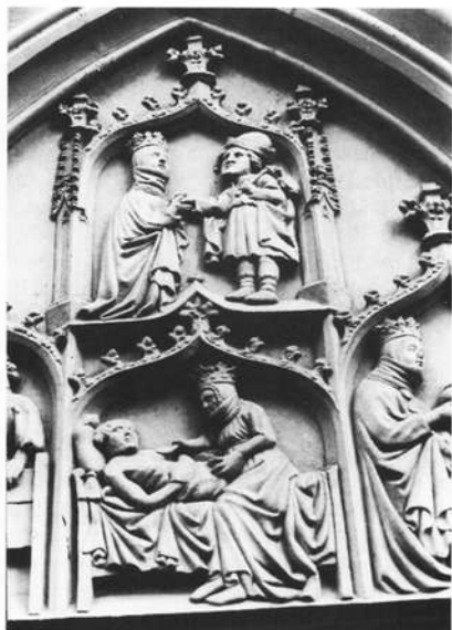
Tympanon über dem Eingang der Spitalkirche (Ausschnitt) mit der Darstellung barmherziger Werke der hl. Elisabeth.

An einem der schönsten Rathausplätze Mainfrankens angekommen, wird der Besucher von der eindrucksvollen Kulisse, gestaltet vom „Neuen Rathaus“, den umgebenden, teilweise noch mit Fachwerk erbauten Bürgerhäusern, der Stadtpfarrkirche St. Andreas, den Straßen und Gassen und dem im Westen beherrschenden Klingentor, voll Erstaunen und Bewunderung sein. Der prächtige Rathausbau, vor 1497 erbaut, dreigeschossig mit vorkragendem Fachwerkbereich, einem großen Satteldach zwischen Treppengiebeln und einem erkerartig in die Fassade eingesetzten Uhrtürmchen, ist der zentrale, alles überragende Blickfang. Ein Stadtwappen,