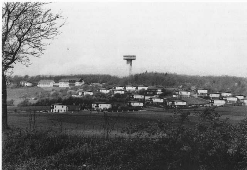
Objekte der Stasi-Begierde hart an der DDR-Grenze: Der Bayernturm bei Zimmerau, das Ferienhausgebiet rechts daneben und der Berggasthof (links neben dem Turm).

1986 feierte die Gemeinde Sulzdorf mit einem großen Fest das 20-jährige Jubiläum des Aussichtsturms. Der Schirmherr des Festes, Landrat Dr. Fritz Steigerwald, betonte beim Festkommers, daß der Bayernturm ein Symbol und Hoffnung auf ein einiges und freies Deutschland sei. Sulzdorfs Bürgermei-