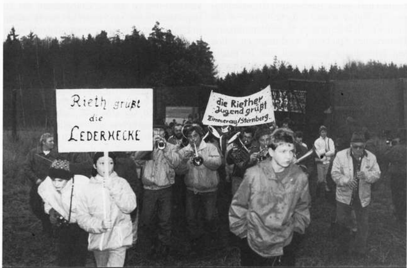
Unvergeßlich – die Grenzöffnung im November/Dezember 1989. Die Aufnahme entstand zwischen Zimmerau und Rieth

Bei den Vorarbeiten für die Herausgabe der beiden vorgenannten Bände machte sich Ger-