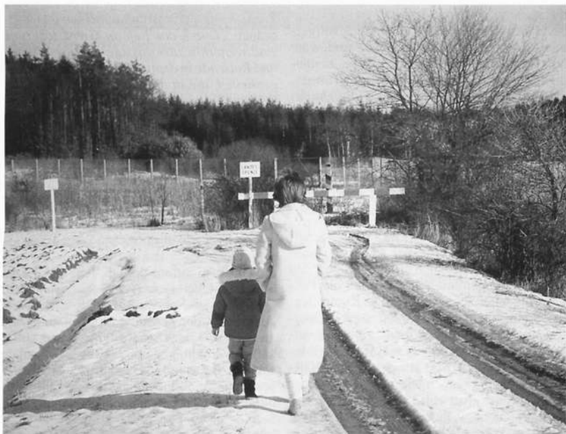
Lange Jahre das „Ende der Welt“ – Wegsperre und „Eiserner Vorhang“ zwischen Zimmerau und Rieth (Thüringen)