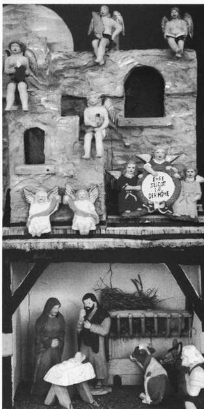
Die Krippe der „Weiß'schen Weihnacht“. Insgesamt erzählen 500 keramische Figuren vom Leben Jesu.

Man kann ohne weiteres von einer Tradition Marktedwitzer Krippenfiguren sprechen. Sämtliche Figuren dieser Krippe stammen aus Marktedwitzer Töpferwerkstätten – auch Hafner genannt. Zum überwiegenden Teil hat der Familienbetrieb Meyer aus der Dammstraße – daher der Name „Dammhafner“ – diese Figuren gefertigt und damit stilbildend gewirkt. Viel weiß man nicht über die genaue Herstellungsverfahren, nur soviel: Die Figuren wurden in Modellen gegossen, mit der