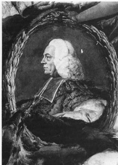
Abb. 5: G.B. Tiepolo: Bildnis des Fürstbischof C. Ph. von Greiffenklau, Treppenhaus der Residenz