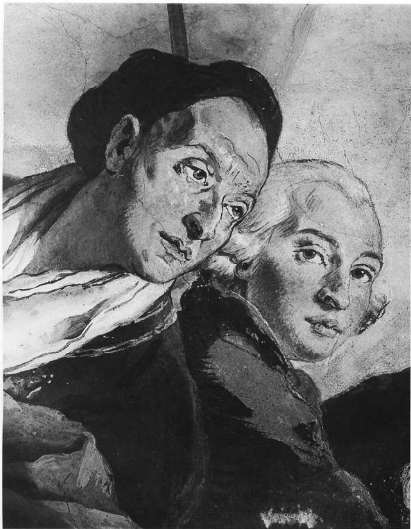
Abb. 1: G. B. Tiepolo: Selbstbildnis und Bildnis des G.D. Tiepolo (?), Würzburg Residenz, Treppenhause

Gegenteil: Der Hellebardier ganz links, der Fahnenträger rechts, der aus dem Bild zum Betrachter blickende Page mit dem bischöflichen Pluviale und nicht zuletzt der pracht-