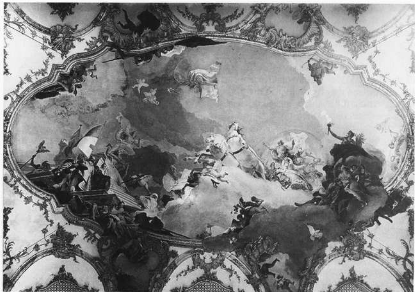
Abb. 3: G.B. Tiepolo: Der Genius des Reiches und seine Braut, Kaisersaal der Residenz

schen den Gattungen, das als erster der römische Künstler Gianlorenzo Bernini in die Barockkunst einführte, gibt sich der Sinn des Zeitalters für witzige Überraschungen, für Augentäuschung ( trompe-l'oeil ) und für ironische Wendungen zu erkennen. Tiepolo sollte einer der letzten sein, der die barocke Lust an der Travestie der Kunstgattungen perfekt beherrschte.