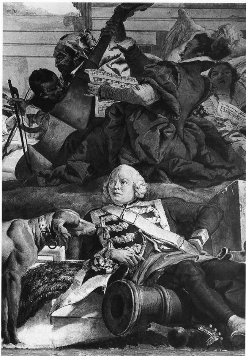
Abb. 6: G.B. Tiepolo: Balthasar Neumann, Treppenhaus der Residenz