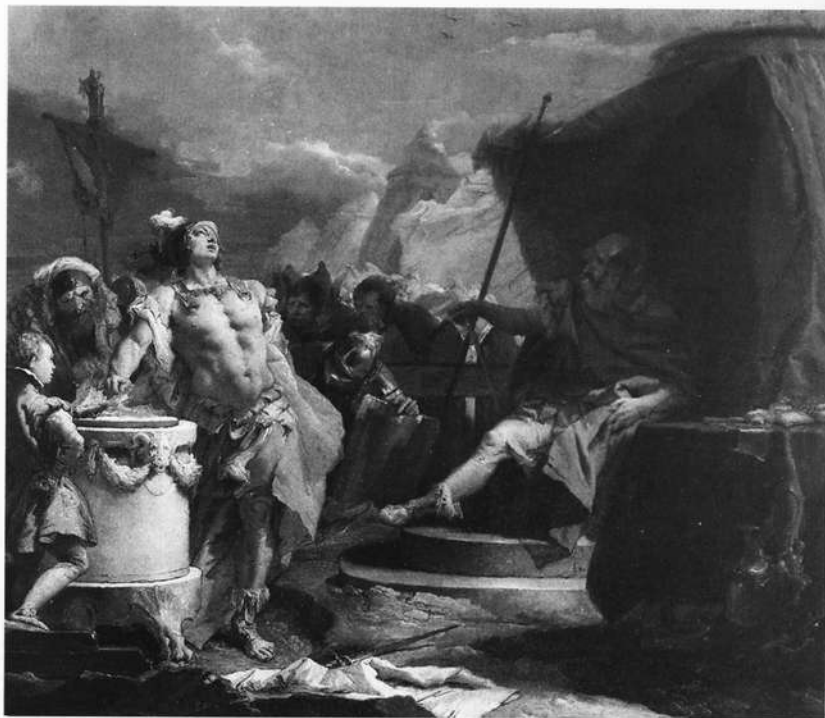
Abb. 8: G.B. Tiepolo: Mucius Scaevola vor Porsenna, Residenz, Martin-von-Wagner-Museum