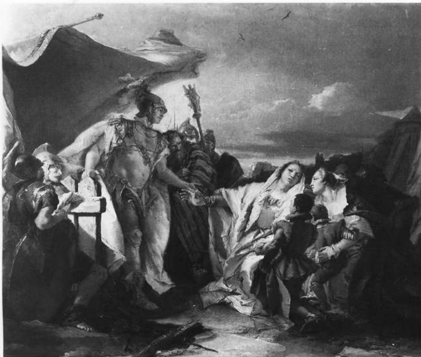
Abb. 7: G.B. Tiepolo: Coriolan vor den Mauern Roms, Residenz, Martin-von-Wagner-Museum

cherte Werke Giandomenicos sind die drei Supraporten des Kaisersaales – Gemälde, die über den Türen angebracht sind –, mit Darstellungen der Kirchen- und Kaisergeschichte. Erstaunlich ist der hohe Grad der Stilanverwandlung, wie sehr der Sohn seine Formensprache der des Vaters anpaßte, obgleich auch Unterschiede zu sehen sind: So neigt der Sohn zu schärferen Kontrasten und zu kälteren Farbtönen. Sicherlich die schönste und in ihrer Poesie unübertroffene Arbeit Giandomenicos während des Würzburger Aufenthaltes ist die Radierfolge der >Flucht nach Ägypten<.