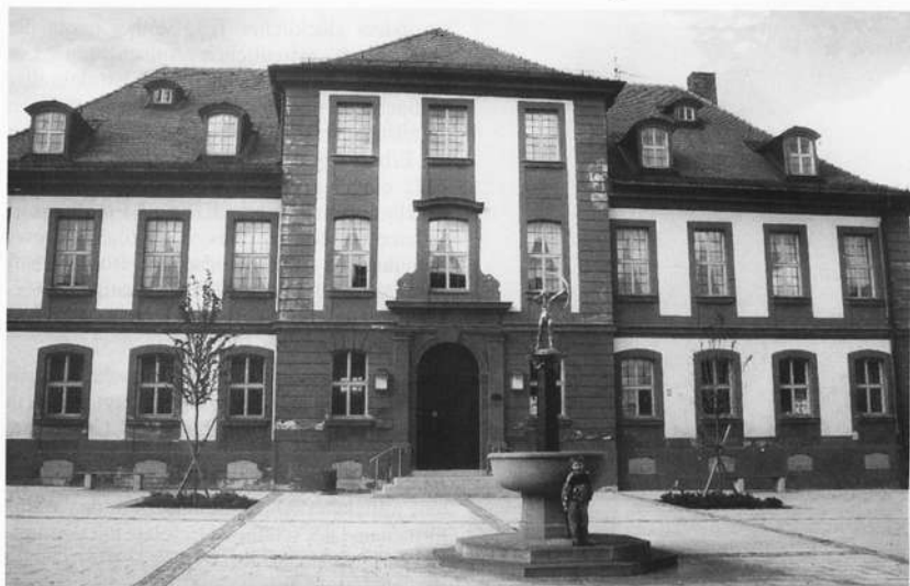
Das Jagdschloß wurde 1749 durch Johann David Steingruber erbaut. Von 1749 bis 1874 war das Gebäude Herzoglich-Sachsen-Coburgisches Jagdschloß, diente von 1874 bis 1982 als sog. „Schloßschule“ und wurde 1982 zum „Haus des Gastes“ umgebaut.