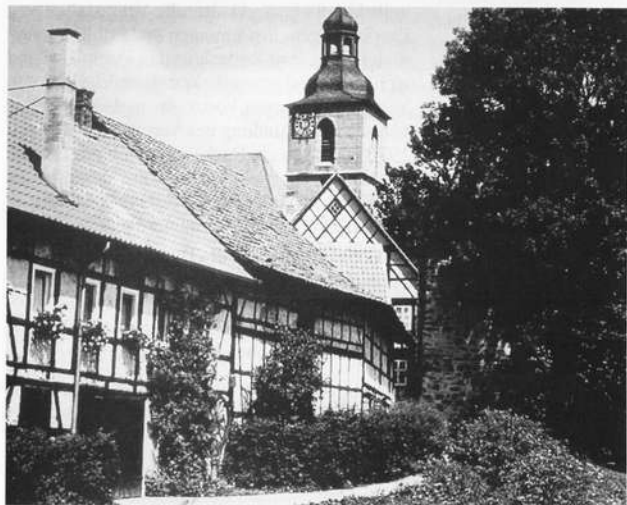
Altstadtansicht mit Johanniskirche