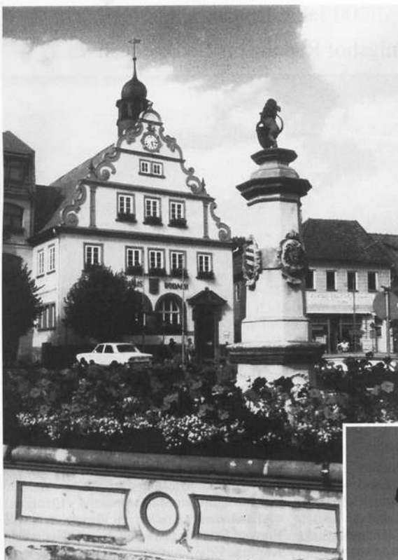
Das Rathaus , davor der Marktbrunnen mit dem „Meißner Löwen“, dem Wappentier der Stadt seit 1347