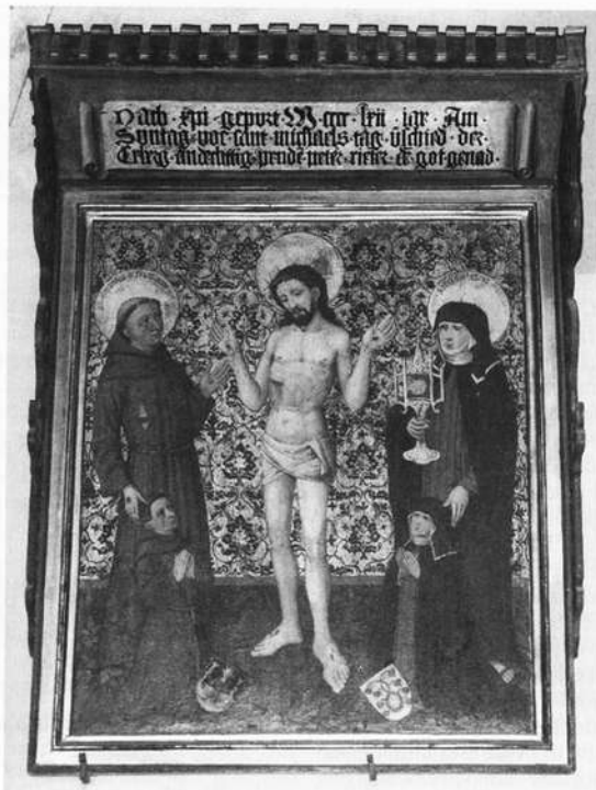
Gemälde des Nürnberger Malers Pleydenwurff: Gedächtnistafel für Peter und Barbara Rieter.

grenzender Wahrscheinlichkeit nachzuweisen, daß dieser Alter ein „echter Riemenschneider“ ist. Das Motiv zeigt den Abschied der Apostel nach dem Wort Christi: „Gehet hin in alle Welt und lehret alle Völker und taufet sie im Namen des Vaters und des Sohnes und des Heiligen Geistes.“