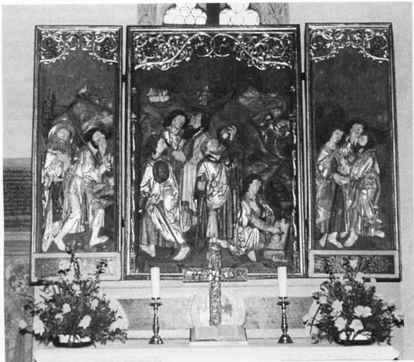
Apostelabschiedsaltar von Tilman Riemenschneider, 1491

ge, in Deutschland noch erhaltene Topfhelm angebracht, der um 1350 zu datieren ist und aus der rieterschen Rüstkammer stammt. Hans Rieter hatte dieses vergoldete Prachtstück für seinen Totenschild bestimmt.