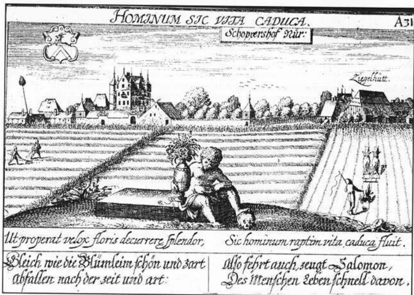
Abb. 4: Der Weiler Schoppershof mit dem Schloßgut im Jahr 1628. Der Kupferstich aus Meissners Schatzkästchen zeigt aus nordwestlicher Sicht den Weiler Schoppershof. Links – im Bereich des Maibaums – erkennt man einige Bauernhäuser, in denen einst die Untertanen des Schloßherrn wohnten, rechts die Ziegelhütte Schoppershof. Dazwischen liegt, von einer langen Mauer mit flankierenden Ecktürmchen begrenzt, das Schloßgut, zu dem ein riesiger Park mit einem sorgfältig gepflegten Hesperidengärtchen gehörte (Meissner, Daniel: Thesaurus Philo-Politicus ,... 3. Ausgabe, Frankfurt a.M. 1628, Privatbesitz).

Unmittelbar nordöstlich des Schloßchens Schoppershof war eine Ortschaft entstanden, in der die von der Grundherrschaft abhängi-