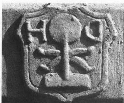
Abb. 3 Das historische Handwerkszeichen eines Weißgerbers als Detail aus der Abbildung 2 bestehend aus zwei Haareisen und aus einem Stollmond/Stollpfahl.