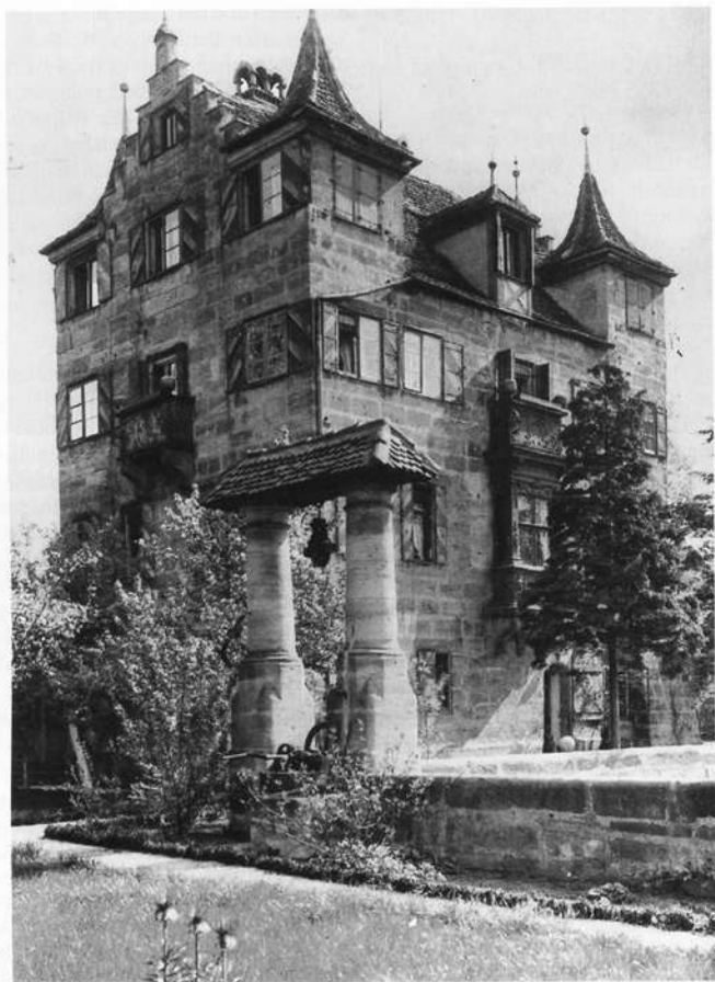
Abb. 1: Das Schlößchen Schoppershof im Jahr 1926. Der Blick ist auf das Südwesteck des Herrenhauses gerichtet. Im Garten vor dem Hauptbau steht ein hübscher Säulenziehbrunnen aus der Barockzeit. Das Schlößchen hat den Zweiten Weltkrieg ohne Schäden überstanden und zählt heute zu den beeindruckendsten und schönsten Schloßanlagen vor den Mauern der Stadt (Stadtarchiv Nürnberg, Bild-, Film- und Tonarchiv, Dr. Nagels Denkmalsarchiv Nr. 3274).