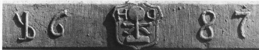
Abb. 2 Der Sturz zwischen der Türe und dem Oberlicht, 1687, als Detail aus der Abbildung 1.