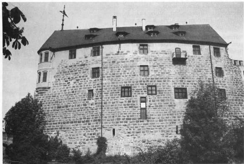
Burg Abenberg bei Roth (Mittelfranken), Stammsitz der um das Jahr 1200 im Mannesstamm ausgestorbenen Rangaugrafen von Abenberg. Hier soll am 17. September ein „Haus fränkischer Geschichte“ eröffnet werden.

Nürnberg, die Eichstätter Fürstbischöfe und die bayerischen Wittelsbacher mündete sie schließlich in der modernen Vernunft-“Ehe“ dreier kommunaler Gebietskörperschaften: Seit 1985 kümmern sich auf gemeinsamer Zweckverbandsebene die Stadt Abenberg, der Landkreis Roth und der Bezirk Mittelfranken in vorbildlicher Weise um die Sanierung und Instandsetzung der prachtvollen Burgranlage, deren ältestes Relikt – die gewaltige Ringmauer aus der Ära der fränkischen Hohenzollern – verblüffende baugeschichtliche Parallelen zur nahen Cadolzburg aufweist.