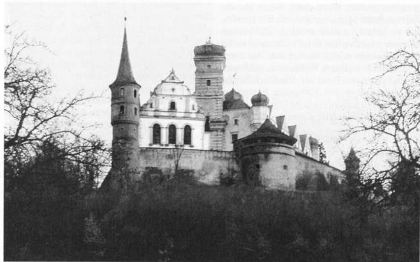
Schloß Schwarzenberg bei Scheinfeld/Mfr.

Die böhmische Geschichte des Hauses Schwarzenberg nimmt gewissermaßen ihren Anfang am 30. 1. 1612. An diesem Tag bewegt sich ein langer Trauerzug von Wittigau, dem heutigen Třebon, zum Kloster Hohenfurt (Vyššy Brod). Im Sarg liegt die Leiche des Petr Vok, des letzten Mitgliedes der Familie Rožmberk (Rosenberg), die nach und nach die wichtigsten Städte und Landschaften in Südböhmen in ihren Besitz gebracht und unter dem Zeichen der fünfblättrigen Rose vereint hatte. Sie wiederum waren Nachfolger des legendären Herrschergeschlechts der Wittigonen oder Vítkovci, über deren dunkle Ursprünge uns Stifters Wittiko-Roman berichtet. Nach Petr Voks Tod, den Wirren der Böhmisches Erbfolgekriege und des 30jährigen Krieges wurde das Land der Rosenberger im wesentlichen zerteilt. Neuer Besitzer von Gratzen und der Stadt und Herrschaft Rosenberg wird der kai-