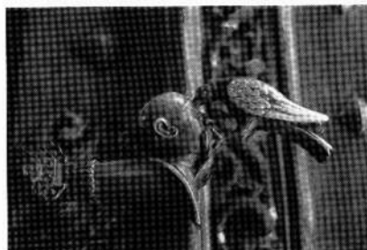
Türgriff (mit dem Schwarzenbergischen Wappen) im Schloß Hluboká / Frauenberg

Durch das Budweiser Tor erreicht man das Denkmalschutzgebiet der Altstadt, die Husstraße führt geradewegs zum Augustinerkloster mit der St. Ägidiuskirche aus dem 14. Jahrhundert. Rechts biegt man in die Brezanstraße ein, spaziert durch Laubengänge, kommt auf den Masarykplatz, den Hauptplatz mit der Mariensäule aus dem 18. Jahrhundert, sicher neben dem von Telč und Slavonice einer der schönsten Kleinstadtplätze Böhmens. Prachtige Renaissance- und Barockhäuser umstehen den Straßenmarktplatz, der sich vom Schloß zum unteren Tor zieht, der