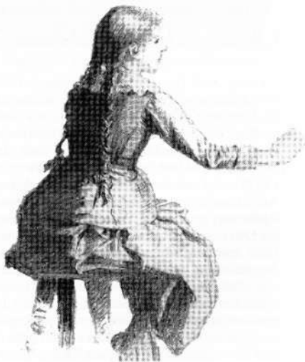
Aus dem Skizzenbuch des Malers: Hund /Schulmädchen

Dem Verfasser dieser Sprenger-Würdigung wurde es nicht leicht gemacht, Werke des Künstlers aufzuspüren. Die Landbevölkerung war noch nie angetan, Kunstwerke zu erwerben. Der Kreis seiner treuen Verehrer und Besitzer von Bildern war über das ganze Land verstreut. Das breite Spektrum seiner Darstellungen begünstigte dies. Zahlreiche Bildnisse schöner Frauen zu schaffen gehörte zu seinem künstlerischen Repertoire. Zu den Landschaftsbildern aus der Fränkischen Schweiz kamen die Tierstudien. Seine Werke waren keine Zufallsprodukte. Hohes künstlerisches Können, eine zähe Ausdauer und ein enormer Fleiß kennzeichnen den Meister. Sprenger erkannte, wo und wie das Leben sich darstellte, und seine Bilder verraten viel davon. Er war ein gründlicher Beobachter seiner Objekte, und er war ein glücklicher Gestalter. Im vorgerückten Alter suchte er mehr die Stille. Er war Künstler und so sah er