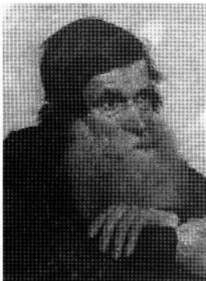
Der Einödbauer (Privatbesitz)

Letzteres Bild dürfte bereits in der Fränkischen Schweiz entstanden sein; es befindet sich in Egloffstein in Privatbesitz.