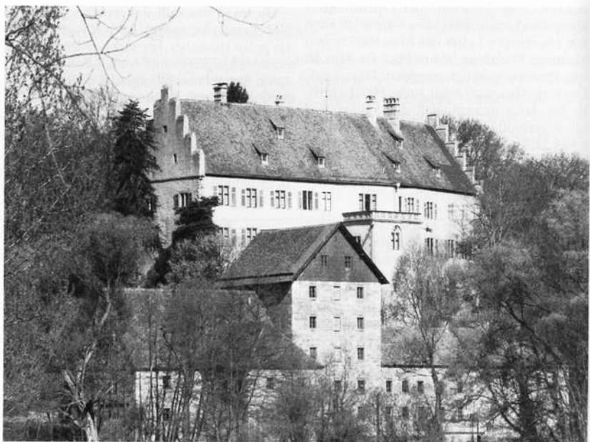
Schloß Aschach an der fränkischen Saale