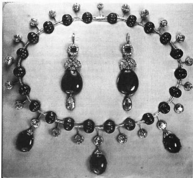
Schloß Aschach: Teile des Familienschmucks von insgesamt ca. 240 Karat Smaragden und Brillanten.