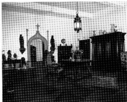
Untere Halle mit Portal zur Silberkammer

Sinne der Besucherpsychologie auf der Verbindung von landschaftlich reizvollem Ausflugsziel mit wertvoller und interessanter Sehenswürdigkeit basiert, im Planungsstadium zu entwickeln oder gar an seine spätere Realisierung zu denken. Durch eine gezielte Werbung in verschiedenen Richtungen konnte diese mittlere Dauerfrequenz wesentlich erhöht werden, wobei freilich, im Hinblick auf den Charakter des Hauses, auf Provokation von Massenbesuch jeder Art verzichtet wird; dadurch ist der malerische Schloßkomplex mit seinem blumengeschückten Hof und dem kleinen englischen Park, trotz seines neuen Zweckes, eine Insel des Friedens geblieben. Aus den Quellen der Eintrittsgelder und der Café-Pacht sollte ja – neben der Sägewerkspacht – eine merkliche Zubuße zu den Betriebs- und Unterhaltskosten fließen, und hinsichtlich der beiden ersteren, die hier interessieren, da sie vom Besucher abhängen, hat die Erwartung nicht getrogen; in den Sommermonaten der beiden Jahre 1957/58 haben insgesamt fast 15 000 Besucher das Schloß besichtigt.