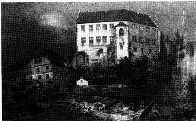
Schloß Aschach: Lithographie von Franz Leinecker (1841)

heraus in die intimere Atmosphäre des alt-deutschen Zimmers gebracht, wo sie für den Besucher auch leichter zugänglich sind.