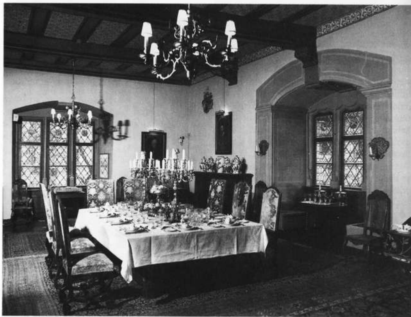
Fürstensaal mit gedeckter Tafel

jene Zeit, ein erkerartiger Vorbau als Stützpfeiler vor die Flußseite des Schlosses gesetzt, der heute der Saalefront schon von ferne, zusammen mit den Treppengiebeln, das charakteristische Gepräge gibt. Im Obergeschoß diese Anbaus findet sich eine Kapellenstube im „Juliusstil“ mit dem typischen stuckierten Rippengewölbe.