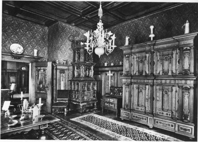
Schloß Aschach, Schreibzimmer

begann. Die Stallungen westlich des kleinen Schlosses, die Hofmauer und die Brennöfen Sattlers dahinter wurden abgebrochen, dadurch der innere Burghof nach Westen geöffnet, die effektvolle Altane gewonnen und anschließend ein kleiner englischer Park angelegt; über der Erkerstube an der Ostfront wurde das Dach entfernt und dafür eine Altane mit neugotischer Fischblasenbrüstung zum weiten Rundblick auf die stillen Wiesenründe des Saaletales angelegt. Eine völlige Umgestaltung größten Stiles wurde im Innern