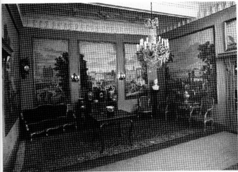
Salon mit Napoleon-Tapete von Duour (Paris) 1829

Die Barockzeit entfernte die alte Wendeltreppe, die gleich links vom Haupteingang ihren Platz hatte; dafür wurde eine geräumige, sehr noble zweiläufige Freitreppe eingebaut, der freilich der halbe Saal geopfert werden mußte, um dadurch seine jetzige Gestalt zu erhalten.