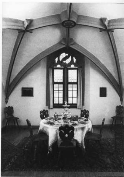
Erkerstube mit gedecktem Frühstückstisch