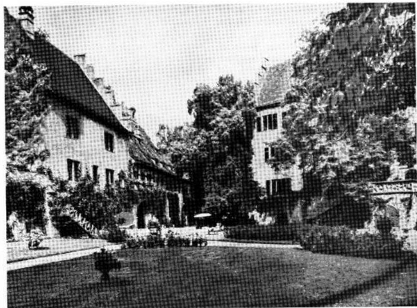
Großes Schloß (rechts) und Kleines Schloß (links)