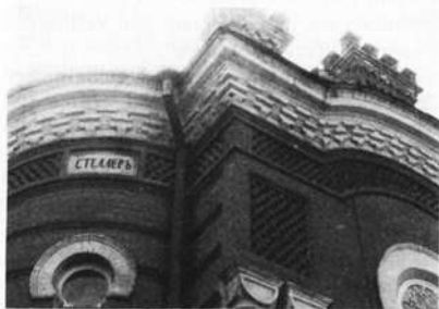
Irkutsker Museum. Teilstück des Frieses mit dem Namen "STELLER".

Der heutige Tourist entdeckt an dem Fries des Museumsgebäudes von Irkutsk am Baikalsee, Zentralsibirien, die eingemeißelten Namen bekannter Gelehrter, darunter auch die Inschrift "STELLER" 1) . Georg Wilhelm Steller gehört aus russischer Sicht zu den großen Pionieren der Erschließung Ostsibiriens, der Kamtschatka, Westalaskas und der Aläuten. Er stand in russischen Diensten: das von ihm gesichtete und betretene Alaska bleibt zusammen mit den Aläuten im Besitz Rußlands weitere 126 Jahre; die USA erwerben diese Gebiete erst 1867 durch Kauf. Doch war Steller vor allem Forscher, Wissenschaftler.