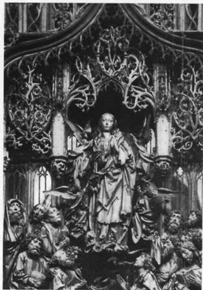
Marienaltar in Creglingen

Kaum ein anderer Künstler verstand es so vortrefflich, die Gesichter seiner Figuren als Träger seelischer Stimmungen mit einem breitgefächerten und fein abgestuften Ausdrucksspektrum zu versehen wie Tilman Riemenschneider und dieser mimischen Gestaltung seinen persönlichen unverwechselbaren