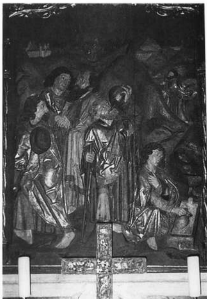
Schrein des Zwölfbotenaltars in Kleinschwarzenlohe

Bei Kennern und Liebhabern von Riemenschneiderwerken entsteht augenblicklich ein Bild: schlanke, zartgliedrige, langfingrige, edel geformte Hände, die, wie ich meine, einmalig in der darstellenden Kunst sind. Diese sensiblen „Künstlerhände“, die man in der Realität nur selten und überwiegend im künstlerisch-geistigen Bereich antrifft – bei großen Pianisten und erstklassigen Chirurgen kann man sie bewundern – unterstreichen die Vornehmheit seiner Figuren, ihre durchgeistigte Haltung und ihren beherrschten Charakter. Fast durchsichtig schimmern diese Hände seiner Gestalten, Adern, Nägel, Fingergelenke sind virtuos gearbeitet. Jeder, der sich eingehend mit dem Werk Riemenschneiders auseinandersetzt, wird diese Hände als typisch für den mainfränkischen Meister wiedererkennen. In unserer modernen Sprache würden wir sagen, sie seien sein Markenzeichen, das keiner weiteren Beglaubigung bedarf. Es ist, als hätte er mit den Händen seiner