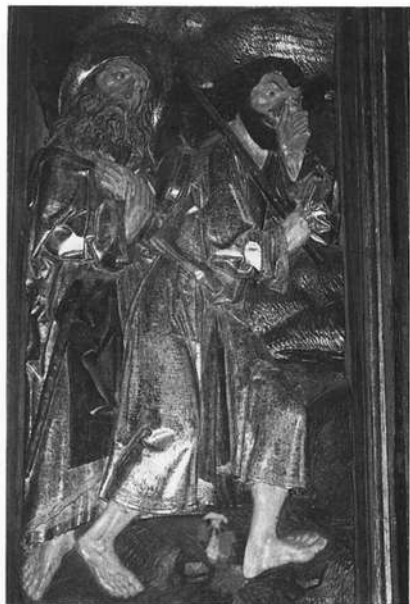
Linker Flügel des Zwölfboten-Altars in Kleinschwarzenlohe