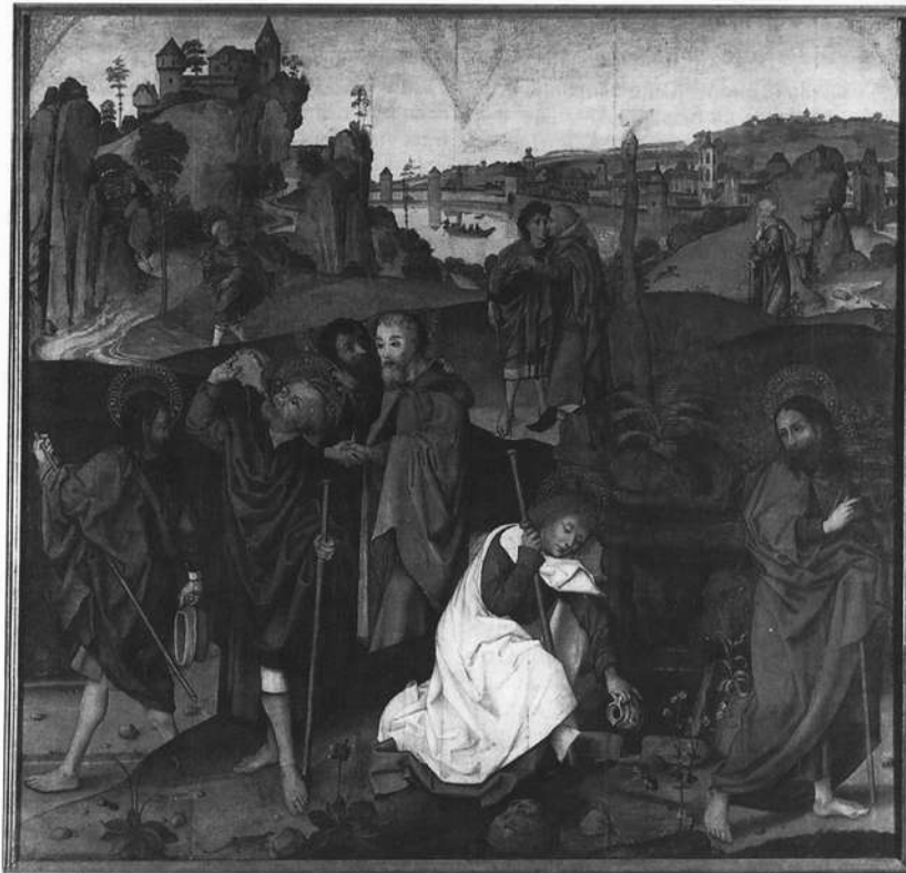
Die Vorlage für den Zwölfbotenaltar: Abschied der Apostel. Unbekannter Nürnberger Meister, um 1500.

stelszene in Kleinschwarzenlohe kann man zwei Gemälde in die engere Wahl ziehen, eines davon befindet sich heute im Historischen Museum der Stadt Bamberg und wurde im Jahre 1483 von Wolfgang Katzheimer geschaffen, das andere stammt von einem unbekanntem Nürnberger Meister um 1500. Beide Gemälde sind fast identisch.