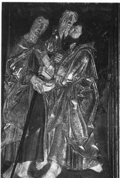
Rechter Flügel des Zwölfboten-Altars in Kleinschwarzenlohe

Wunsch des kleinen Rhönstädtchens von Veit Stoß, der zu jener Zeit aus seiner Heimatstadt Nürnberg verbannt war, farbig gefaßt. Die Münnerstädter Bürger konnten sich nicht für die revolutionär neue Idee Riemenschneiders erwärmen, das Material Holz in seiner Ursprünglichkeit sprechen zu lassen.