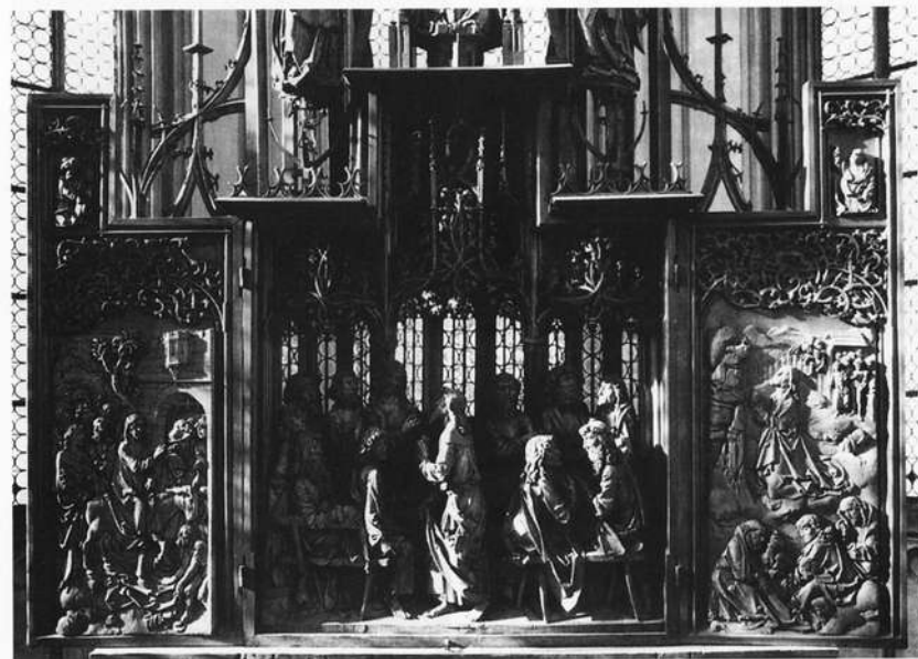
Der Heiligblutaltar in der Jakobuskirche zu Rothenburg o.d.T.