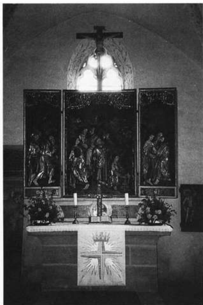
Der Zwölfbotenaltar in der Allerheiligenkirche

Nun drängt sich die Frage auf, wie der Zwölfboten-Altar, der eindeutig mainfränkische Charakteristika aufweist, in die Nähe von Nürnberg gekommen ist, und wo er ursprünglich gestanden haben mag. Das Patro-