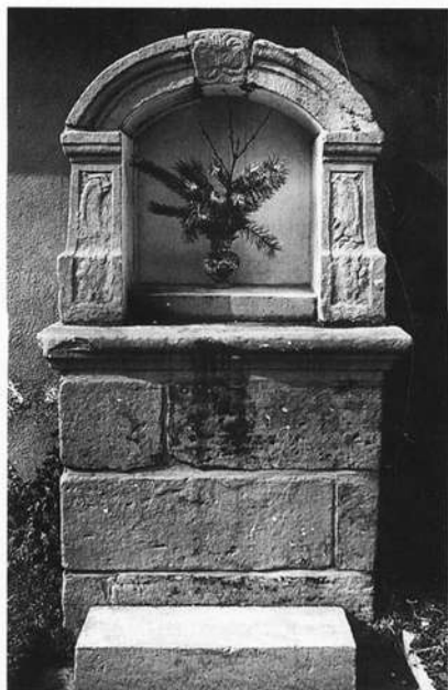
Prozessionsnische in Breitbrunn aus dem 18. Jahrhundert, an der Hauptstraße vor Hausnummer 14, die an den Fronleichnamprozessionen als Altardiente.

In den 80er Jahren des 18. Jahrhunderts wurde die Zahl an Instrumenten und Spielern aufgestockt, und es kamen auch größere Pauken dazu, weil man offenbar an Festtagen in der Kirche sogar kleinere Orchestermessen aufführte, wie die Rechnungen für angeschaffte Noten seit 1761 beweisen 73) . Die Musiker spielten auch an Kirchweihagen zum Tanz auf, was offenbar einträglich, aber nicht immer ganz unproblematisch war. Ein Musiker, Johann "Bell" (Behl) beschwerte sich im Juli 1805 beim Geistlichen Rat, der kirchlichen Oberbehörde in Würzburg, weil ihm die Geistlichkeit das Aufspielen zur Kirchweih am 4. August in Breitbrunn verbieten wollte 74) .