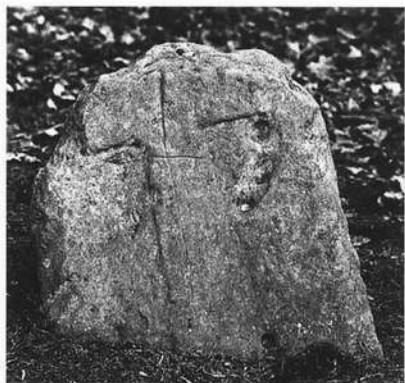
Kreuzstein am Jungfernkreuz bei Kottendorf.

Wohl keine Landschaft ist so charakteristisch durch viele Marterln, Bildstöcke, Flurdenkmale und Kreuze geprägt, wie die fränkische.