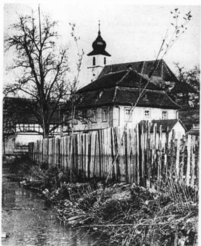
Pfarrkirche und Pfarrhaus zu Kirchlauter am Lauterbach, um 1950.

Solche Hilfen waren auch für die Gründung anderer Pfarreien Voraussetzung. So wissen wir von der Stiftung eines 3 1/2 Morgen großen Weinberges, an dem „ Hermannsberge “, den der Eltmanner Pfarrer bei der Pfarrei Gründung von Stettfeld 1390 dazu gibt 5) .