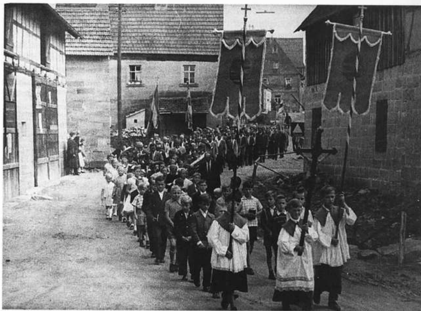
Die Breitbrunner brechen zur Bittprozession nach Neubrunn auf, um 1955.

Auch der aus Breitbrunn stammende Dekan Nikolaus Geißel vermachte 60 Gulden zur Verbesserung der freien Schule nach Kirchlauter und 400 Gulden nach Breitbrunn im Jahre 1779 65) .