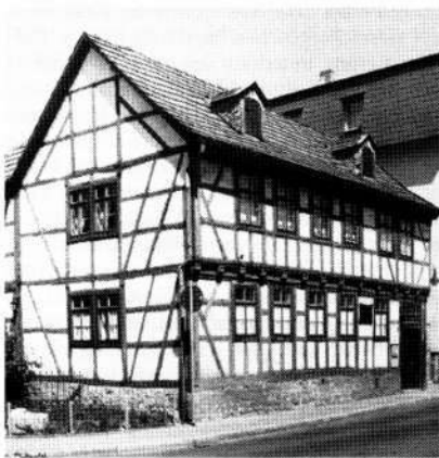
Das einstige Wohnhaus des Dichters Rudolf Baumbach in der Meiningener Burggasse. In ihm befindet sich heute eine ständige Ausstellung zur regionalen Literaturgeschichte.