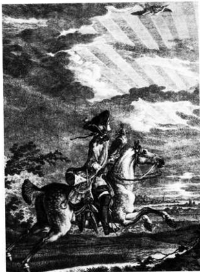
Falkonierknecht zu Pferd mit aufgehaubtem Falken bei der Reiherbeize / Kupferstich von Martin Elias Riedinger

Im gleichen Jahr starb der Vater. Die Markgräfin übernahm für den unmündigen Erben