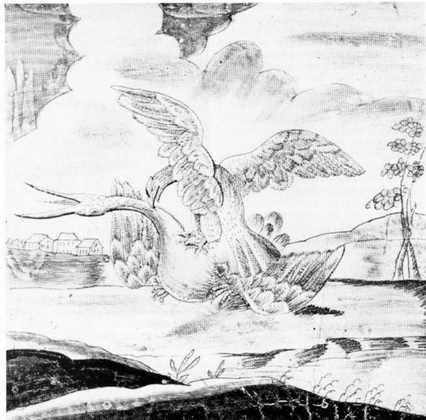
Falke schlägt Reiher / Fayencefliese

sich auf 452855 Gulden, eine gigantische Summe. Etwa die Hälfte davon entfiel auf Personalkosten. Knapp 100000 Gulden wurden für den Kauf und Unterhalt der Beizvögel ausgegeben. Einen Posten für sich bildeten die Doceurs. Diese Geschenke bestanden aus Denkmünzen, sogenannten Falkentalem, und wurden an die Teilnehmer besonders erfolgreicher Jagdpartien verteilt.