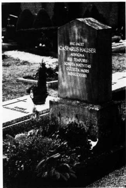
Stets blumengeschmückt: Kaspar Hausers Grab auf dem Heilig-Kreuz-Friedhof in Ansbach.

Doch unabhängig davon könne man davon ausgehen, daß Kaspar Hauser, der sich im zeitgenössischen Ansbach bald zu einem gebildeten Jüngling mit starken musischen Neigungen entwickelt habe, letztlich nur ein Spielball der damaligen europäischen Mächte und ihrer Geheimdienste gewesen sei. Im Bewußtsein der heutigen Epoche freilich sei der Mythos Kaspar Hauser so "präsent" wie nie zuvor. Werner Bürger: "Gerade an der Schwelle zum neuen Jahrtausend erregt das Geheimnis um das ungeklärte Schicksal des mutmaßlichen badischen Erbprinzen wieder starke Anteilnahme."