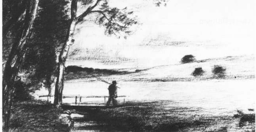
Ludwig von Gleichen-Rußwurm: Bach am Waldrand mit Steg, Bonnland im Juni 1892. Bleistiftzeichnung. Städt. Galerie Würzburg

Wann genau er auf die neuen Strömungen in der französischen Malerei aufmerksam wurde und sich künstlerisch mit ihr auseinandersetzen begann, ist unklar. Meist wird das Jahr 1878 angegeben. In diesem Jahr malte er das Bild "Mainlandschaft". Ähnlich wie Courbet oder Monet, setzte er Menschen und Tiere silhouettenhaft dunkel vor hellen Grund, oder umgab sie mit einer dunklen Kontur, um so ihre Bewegung oder ihr Volumen zu betonen.