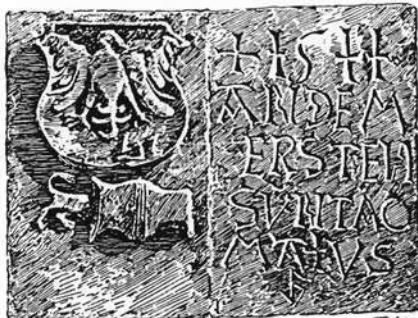
Bauinschrift an der Pfarrkirche

Das dem Vogel Strauß unterstellte Verhalten, daß er bei Gefahr den Kopf in den Sand stecken würde, ist vielen als Geschichtchen oder als Redensart bekannt. So muß dieser imposante Laufvogel symbolhaft immer wieder für Ignoranten herhalten, die Unangenehmes weder hören noch sehen wollen.