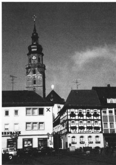
Vom 66 m hohen Turm der Stadtpfarrkirche von Bad Königshofen erklingen die Liedchen des Stadttürmers.

"Ich hab mich ergeben", "Abschied", "Die Gazelle" und "Ave Maria" sind einige der Kompositionen betitelt, die der rüstige Landwirt hoch in Ehren hält.