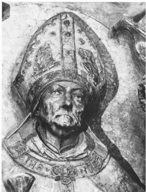
Kopf Rudolf von Scherenbergs von seinem Grabmal im Würzburger Dom, ein Werk Tilman Riemenschneiders, entstanden 1496/99.

und glauben, daß die Strafe der Suspension sich nicht auf sie erstreckt, wenn sie vom Gottesdienst fernbleiben, falls sie nur eine kurze Zeit, wenn auch nur während einer Lektion, einem einzigen Psalm, der Epistel, dem Evangelium gegenwärtig gewesen seien. Haben sie diese wenigen Minuten beim Gottesdienst zugebracht, so behaupten sie, der pflichtmäßigen Präsenz nachgekommen zu sein, und wenden sich wieder ihrem ausgelassenen Treiben und ihren weltlichen Beschäftigungen zu. Zur Zeit der Weinlese bleiben sie ganz vom Gottesdienst weg und halten Vakanz ...". 7)