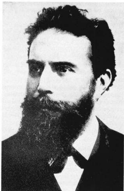
Wilhelm Conrad Röntgen, mit zeittypischer Bartracht

An der Würzburger Julius-Maximilians-Universität, der Alma mater herbipolensis, haben im Laufe der Jahrhunderte überaus bedeutsame Gelehrte gewirkt. Auch in der Würzburger Medizingeschichte stoßen wir immer wieder auf herausragende Ereignisse und Persönlichkeiten: So finden wir hier beispielsweise um 1800 den Begründer akademischer Chirurgie, Karl Kaspar von Siebold. Würzburg gilt als die Wiege der Orthopädie. Würzburg beherbergte den ersten akademischen Zahnmediziner. Hier forschten im vorigen Jahrhundert so bedeutende Männer wie der Pathologe Rudolf Virchow, der Kliniker Johann Lukas Schönlein und der Anatom Albert von Koelliker. In Würzburg fanden Nobelpreisträger ihre Ausbildung, und in der Stadt am Main wurden 1895 die epochemachenden Röntgenstrahlen entdeckt.