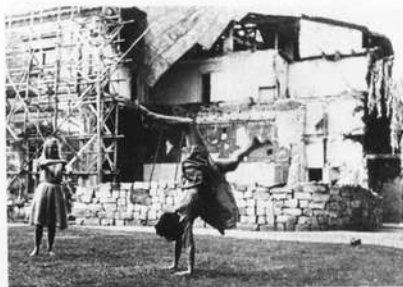
Girls tanzen vor der zerstörten Villa Wahnfried. Foto aus dem Jahr 1945 Archiv Bernd Mayer

Manche Bürger hielten den Wiederaufbau gar für einen Schildbürgerstreich, die Verwirrung der Geister war groß. Noch Ende 1951 wurde vor einer "Kopie" historischer Bauten gewarnt. Aus der Not, so heißt es, sei eine Tugend zu machen, in diesem Fall "aus den Trümmern vergangener Jahrhunderte" eine moderne Geschäftsstraße. Eine Straße solle in gerader Linie den Marktplatz mit dem Luitpoldplatz verbinden und das Alte Schloß als "lästigen Querriegel" überwinden. Als im Oktober 1952 Richtfest für den ersten Abschnitt des Wiederaufbaues gefeiert wurde, trauerte sogar der Leiter der Bauarbeiten, Baurat Strauß, den angeblich verpaßten städtebaulichen Möglichkeiten nach: Ihn selbst, so klagte der Staatsdiener, erfasse eine leichte Resignation angesichts der Überlegung, welche Chancen sich gerade an dieser Stelle zur Errichtung eines modernen Bauwerkes ergeben hätten. Das bayerische Finanzministerium ließ indes glücklicherweise keinen Zweifel: Bei der Sanierung des Barockbaues handele es sich um eine "Ehrenpflicht" des Staates.