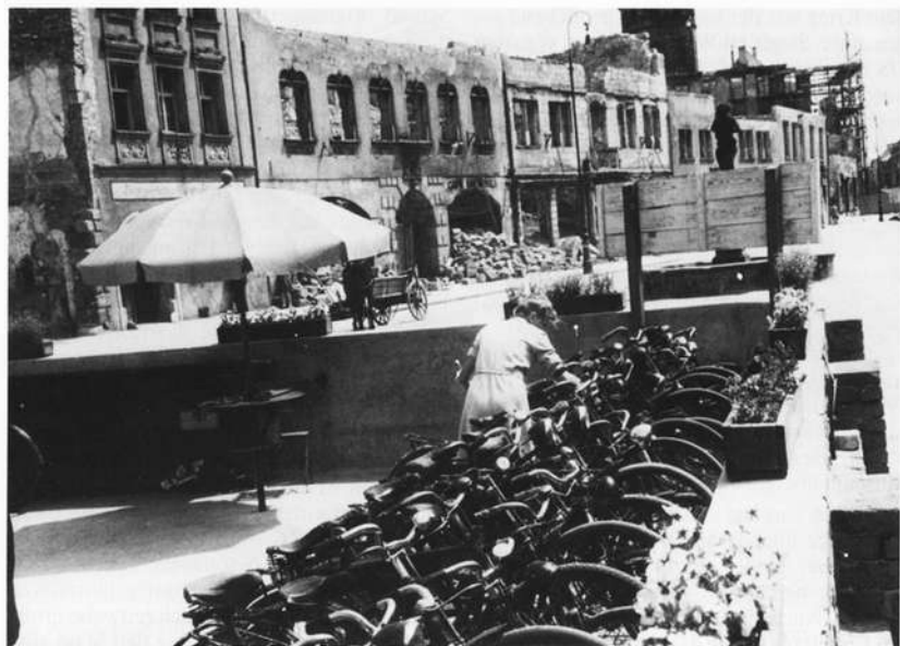
Die Marktplatz-Nordseite im Jahr 1947. Oben rechts das alte Schloß