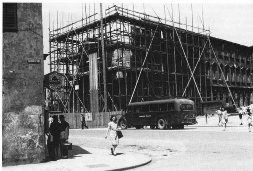
Das Alte Schloß am Marktplatz im Mai 1947. Sein Wiederaufbau schien in der Nachkriegszeit vielen Bürgern überflüssig zu sein.

Schlimm erging es zwei anderen prachtvollen Baudenkmalern, die frühe Schöpfungen des großen Baumeisters Carl Philipp Gontard (1731-1791) waren: dem Reitzenstein-Palais, für Cosima Wagner "der edle Schmuck des Luitpoldplatzes, und dem Jägerhaus (Bezirksamt) Ecke Bahnhof-/Tunnelstraße. Beide Gebäude waren im Krieg schwer zerstört worden, doch anders als beim Alten Schloß wäre zunächst kein Bürger auf den absurden Gedanken gekommen, ihren Wiederaufbau in Zweifel zu ziehen. Der Weg zum Abbruch war indes mit guten Vorsätzen und Absichtsbekundungen geradezu gepflastert.