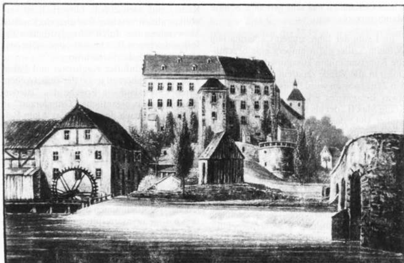
Ansicht von Schloß Aschach aus dem "Album de Kissingen" um 1845

Ähnlich wie bei dem Mainberger Besitz konnten die großzügige Schloßanlage und die Räume im Innern bestens als Produktions-