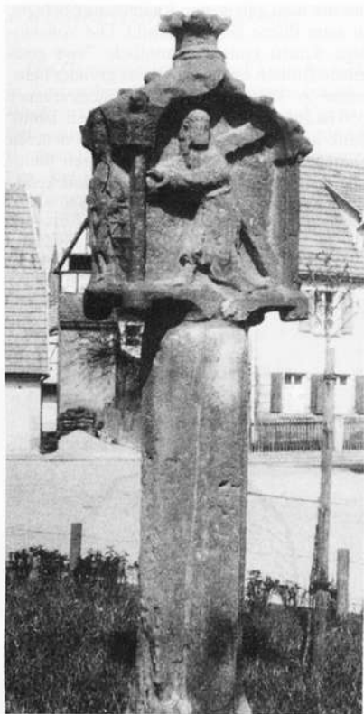
Kronach – Pestmarker

verwittertes Wappen. Unter gedrückten, mit Krabben verzierten Kielbögen, zeigen sich beeindruckende Reliefs am seitlich ausladenden Aufsatz. An den Schauseiten Kreuzigungsgruppe und Kreuzschlepper, gegen Norden hl. Barbara, gegen Süden hl. Katharina. Der Aufsatz schließt ab mit einer Kreuzblume.