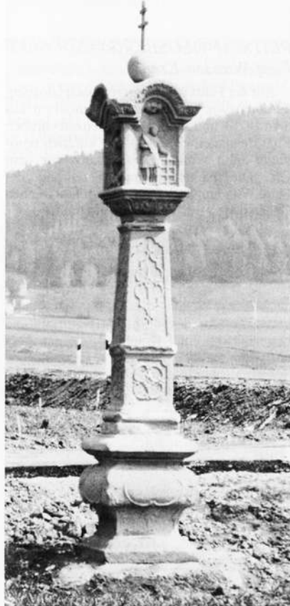
Glosberg – Marter 1767