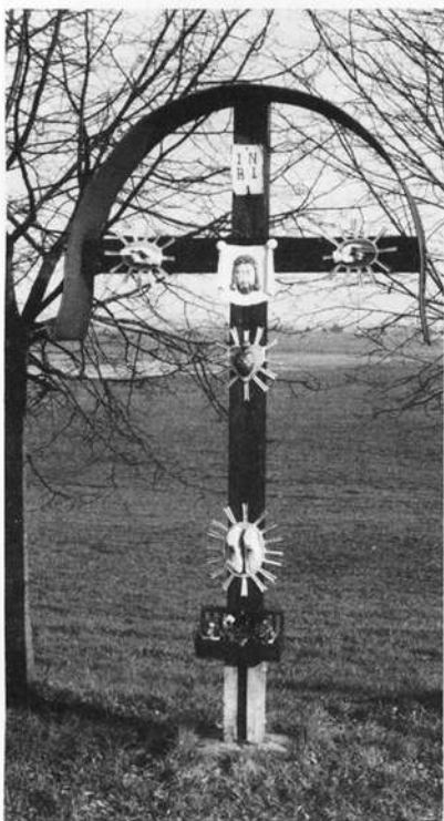
Reitsch-Glosberg – Fünf-Wunden-Kreuz

Bis zum Ausbau der Landstraße zwischen den Orten Haig und Haßlach führte nur ein schmaler Fußpfad an dieser kleinen Wegkapelle vorbei. Sie stand jahrelang im Schatten eines mächtigen Kastanienbaumes, der unter großem Protest der Bevölkerung der Axt zum Opfer fiel. Heute ragt der quadratisch angelegte Putzbau aus dem 19. Jahrhundert kahl, einsam und verlassen inmitten der Wiesen und Äcker auf. Der Stifter gelobte den Bau für den glücklichen Ausgang eines Grundstücksprozesses mit sehr hohem Streitwert. Hätte er den Prozeß verloren, so wäre er um Haus und Hof gekommen. Das Flurstück nennt sich "Kapellenacker".