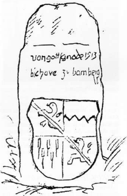
Kronach – Grenzsteinkopie

der mit dem gebogenen Rautenkranz belegte, in zehn Plätze geteilte Schild. Die Vollständige Schrift lautete vermutlich: "von gotts gnade fridrich churfürst vn has gbruder herezoche zv sachsen 1513". Die Steinnummer 656 ist auf der linken Schmalseite (v. d. bamb. Seite aus gesehen) eingehauen und neueren Datums. Auf der satteldachförmigen Steinoberseite zeigt eine eingeritzte, abknickende Linie (Weisung) den Grenzverlauf an.