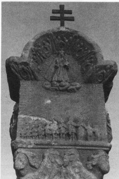
Glosberg – Sandsteinmarter 1733

Auf der "Ellmersmarter" ist die Stifterfamilie des Hans Ellmer von Glosberg dargestellt. Kreuze über den Köpfen der Kinder verweisen auf den Tod. Die Überlieferung berichtet von einer Krankheit, die ein Kind nach dem anderen dahinraffte. Das tragische Schicksal steht in den Matrikelbüchern 1721 bis 1736. Vom 9. 5. 1724 bis 27. 4. 1733 verstarben fünf Kinder. Mit der Stiftung der Marter zu Ehren der Muttergottes hörte die Kindersterblichkeit auf.