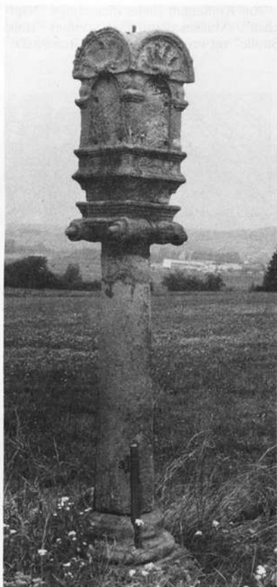
Grundfeld – Bildstock

Zahlreich vorhandener Bildstocktyp (Marter) in den Landkreisen Lichtenfels und Bamberg. Hinzu kommen am Sockel befindliche Puttenköpfe (hier verdeckt). Charakteristisch sind u.a. die tieferliegenden Bildnischen, deren bemalten Blechtafeln fehlen und das darüberliegende Muschelwerk.