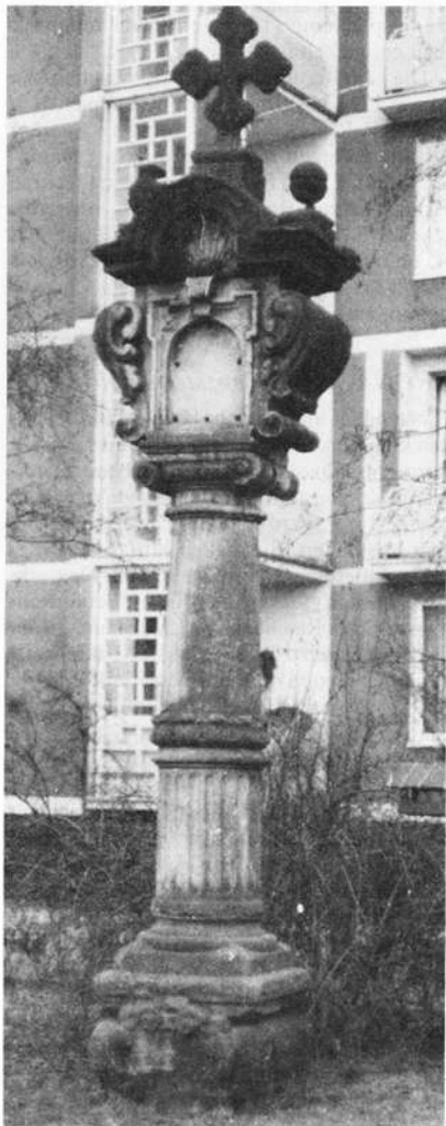
Kronach – Schwedenmarker

sant ist der teilkannelierte Säulenschaft, ein Hinweis auf die Erbauungszeit (1680–1700). Die neugemalten Blechtafeln zeigen den hl. Johannes/T., Patron der Stadtpfarrkirche und den hl. Sebastian, Patron der Kreuzbergkapelle.