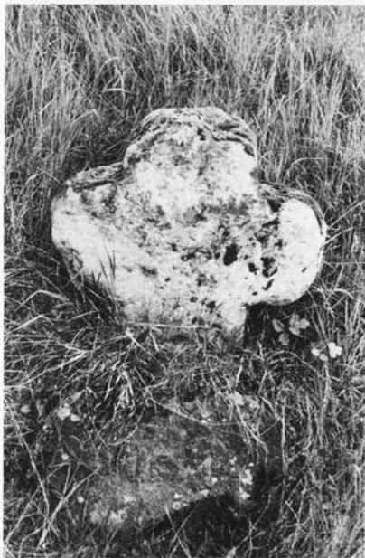
Mannsgereuth – Steinkreuz

Sehr einfach gehaltenes Steinkreuz, eingelassen in einen Sockelstein mit der Jahreszahl "1641". Hier von einem Sühnekreuz zu sprechen ist sehr fraglich, da mit der Einführung der Halsgerichtsordnung durch Kaiser Karl V. 1533, die Totschlagsühne abgeschafft wurde.