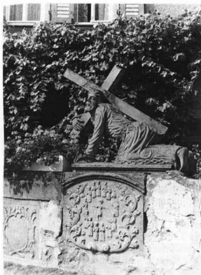
Goßmannsdorf, Haßberge (Ufr.):

An der Hauptstraße erinnert unter der Figur des Kreuzschleppers (18. Jh.) ein Relief des Erscheinungsbilds von Vierzehnheiligen ("Kinderkranz") an die alte hier durchführende Wallfahrtsstraße