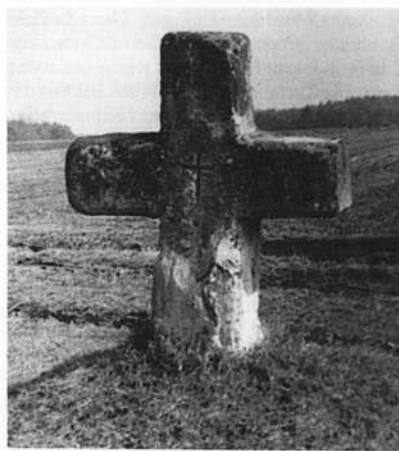
Vom Original zur Rekonstruktion Sühnekreuz von 1535 bei Großschwarzenlohe, Lkr. Roth

Die Konservierung von Flurdenkmälern ist gewiß ein hochinteressantes Thema. Wenn ich mir vorstelle, daß jahrzehntelang Flurdenkmäler falsch behandelt wurden und nicht Erhaltung erreicht, sondern Zerstörung eingeleitet wurde, dann werde ich wütend. Wütend über mich selbst, weil ich mich einlullen ließ und den sogenannten Experten geglaubt habe. Denn diese gingen doch Wanderpredigern gleich durch die Lande und haben ihre Kenntnisse firiert, haben Landräte geflinkt, die aus gutem Glauben heraus Bildstockaktionen finanziert haben, degradierten Heimatpfleger zu Wasserträgern – und be-