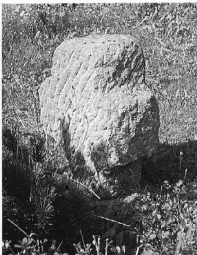
Sühnekreuz von 1511 bei Großschwarzenlohe, Lkr. Roth