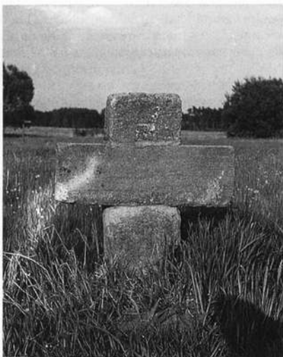
Ehemals Barockmarter, begradigt von "Künstlerhand"

Sühnekreuz von 1511 bei Großschwarzenlohe, Lkr. Roth