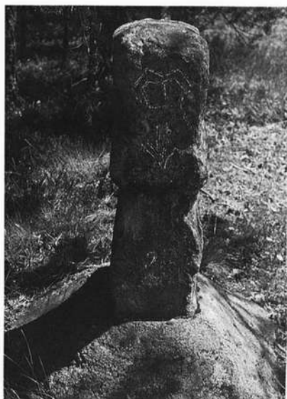
Geleitstein bei Schwand, Lkr. Roth. Zuerst umgeworfen, dann "liebevoll" in Beton gesetzt