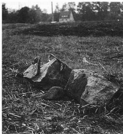
Sühnekreuz von 1535 bei Großschwarzenlohe, Lkr. Roth