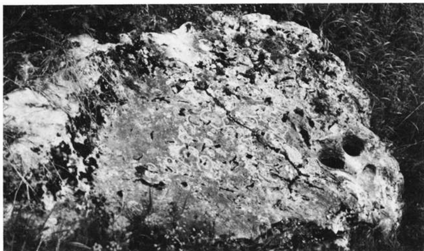
Der Kunigundenstein in der Nähe der Pfarrkirche St. Kunigund auf dem Altenberg bei Burgerroth