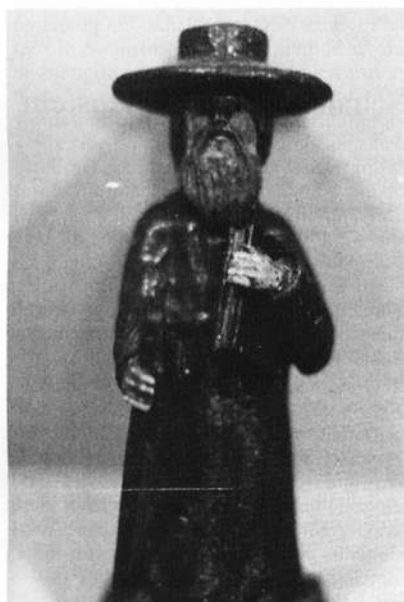
Wandernder Rabbi, (Ostheimer Holzfigürchen, 19. Jahrhundert): Symbol für die jahrtausende lange Suche nach einer Heimat.

diese Thorarolle stammt, ist leider nicht mehr zu rekonstruieren. die zum Teil aus Silber und Gold gefertigten Kultgegenstände und Hochzeitsgeschenke sind alle Aufmerksamkeit wert.