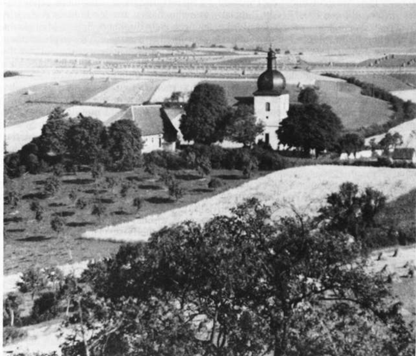
Ein geschichtsträchtiger Hügel im Steigerwald-Vorland ist der Eschenauer Kapellenberg

über ihren Sohn Graf Perahtold/Berthold die Stammutter der königlichen Kammerboten Erchanger und Berthold, die zur Zeit König Konrads I. versuchen, ein schwäbisches Stammesherzogtum erneut aufzurichten.“ 14) Von Zubo ist vergleichsweise wenig bekannt, doch mag er in denselben Tradentenverband gehören.