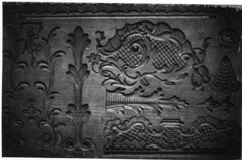
Ausschnitt aus einem Tafelaufsatz, ehemalige Konditorei Ansbach, 18. Jahrhundert.

Landesfürsten und deren Gemahlinnen, bekannte Pfarrerherren oder Soldaten und nicht zuletzt auch Ortsbekannte Originale, wie der "Gänskrong" in Nürnberg aus dem 19. Jhd.