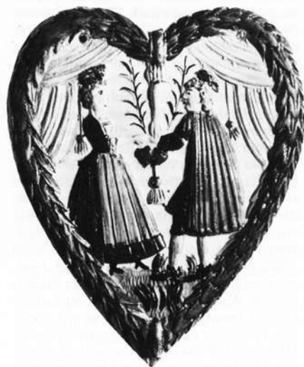
Die segnende Hand Gottes beschließt den Ehebund. Markgrafenmuseum Ansbach, 18. Jahrhundert.

„Das Marzipan“, wie der Volksmund in Franken und auch in der Oberpfalz das von Backmodel abgeformte Gebäck nennt, kennen wir heute nur noch als Weihnachtsg Gebäck. Es ist die letzte Phase einer früher reichen und umfassenden kulturellen Bildsprache, die für unsere Vorfahren über 500 Jahre lang richtungsweisend war und die mit dem Aufkommen der Industrie und der Fotografie langsam ihr Ende nahm.