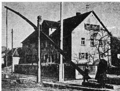
Der schöne alte Ziehbrunnen von Beyerberg

Erneuerung öfters "abwerfen". Es konnte aber auch vorkommen, daß der Schniewel brach und Menschen dabei zu Schaden kamen. So etwa 1707 ein 20 Jahre altes Mädchen in Wilburgstetten, als sie das Vieh tränken wollte. Oder – wie der Aufkirchner Chronist Keßler berichtet – 1721 in Frankenhofen ein Knecht, als der Brunnen-schnürkel brach. (Im Mainfränkischen hieß man den Zugbalken Brunnenschnierer).