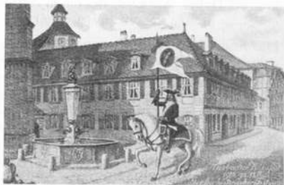
Reitender Herold: Hintergrund Anwesen Joh.-Seb.-Bach.-Pl. 5 (Beringerhof) vor der Aufstokung im Jahre 1912

Anordnung des Fürsten nach ihm benannt; dies im Gegensatz zum Georgsbrunnen vor dem Stadthaus, der von dankbaren Untertanen so geheißen wurde.