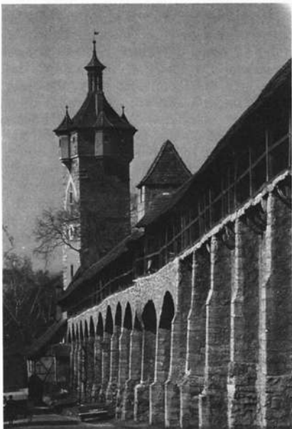
Die Rothenburger Stadtmauer östlich des Klingentores war die Einbruchsstelle bei Tillys Angriff 1631. Im Hintergrund die Klingentur.

chens in Rothenburg von 1389. Bei der Benennung der topographisch durch die Verkehrswege besonders artikulierten Tortürme konstatieren wir ein sehr unterschiedliches Verhältnis. In Rothenburg klingt die nordsüdliche "Fernstraße der Reichsstädte" von Würzburg nach Augsburg (heute "Romantische Straße" genannt) nur im nordöstlichen Würzburger Tor an (auch Galgentor genannt). Sonst konzentriert man sich auf den lokalen Bereich wie beim Gepsattlertor (auch Siebersturm genannt), beim Kobolzellertor, beim Röderertor, beim Burgtor und beim Spitaltor. In Nördlingen zitiert man nächstgelegene Ortschaften aus dem engeren Riesbereich. Da wird u. a. gesprochen vom Löpsingertor, Reimlingertor und Deiningertor. Dies geschieht in Dinkelsbühl nur teilweise, nämlich beim Wörnitztor und beim Segringertor. An der kreuzenden Nordsüdstraße (Reichsstadtstraße) werden die reichsstäd-