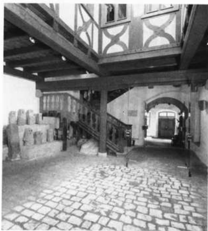
Innenhof mit Abteilung Markungssteine

Textpräsentation, die von mehreren anderen Museen übernommen und mit einem staatlichen Sonderzuschuß gefördert wurde.