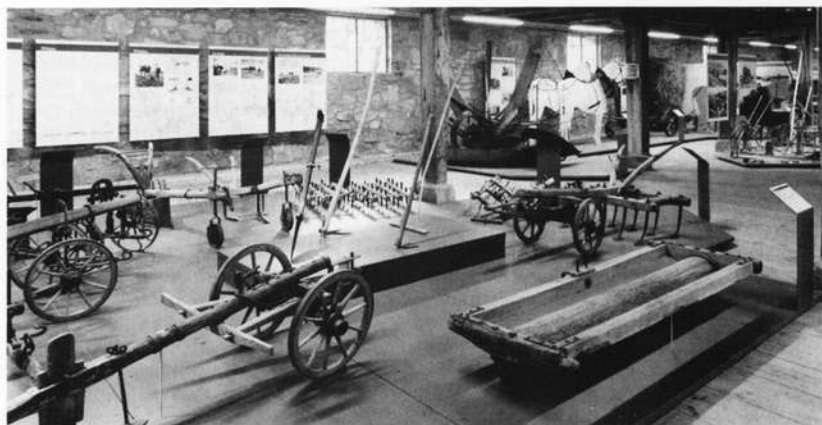
Gerätemuseum Ahorn – Abteilung "Bodenbearbeitung". Im Hintergrund ein Schwadenleger mit Pferdegespann (Abteilung "Ernte").

ausgestellten Geräten einen persönlichen Zugang zu den Exponaten verschaffen.