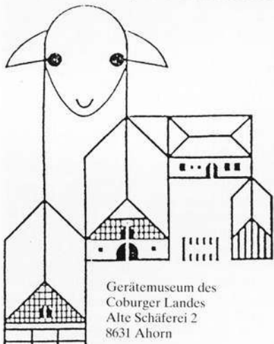
Gerätemuseum des Coburger Landes Alte Schäferei 2 8631 Ahorn

Landwirtschaftliche Geräte des 19. und 20. Jahrhunderts im Coburger Land