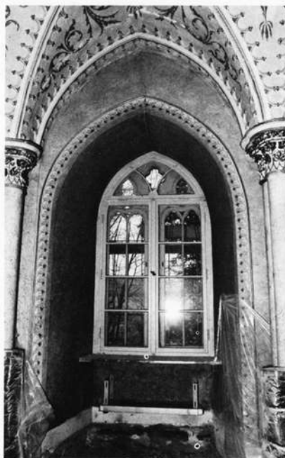
Während der Instandsetzung November 1985

Der Schloßbesitz Rosenau – ehemalige Burg – wurde 1439 erstmals als Sitz der Herren von Rosenau , die Coburger Münzmeister waren, urkundlich erwähnt. Im Jahre 1610 erwarben die Coburger Herzöge den Besitz. Nach einigen Eigentümerwechseln wurde 1805 die Rosenau wieder an Herzog Franz Friedrich Anton von Sachsen-Coburg-Saalfeld übergeben. Dessen Sohn Herzog Ernst I. ließ nach dieser Zeit bis ca. 1820 die Gebäude und den Landschaftspark unter Verwendung von Teilen der alten Anlage neu gestalten. Hierfür wurden bedeutende Künstler, insbesondere Carl-Friedrich Schinkel , herangezogen. Damit erhält die Rosenau eine Bedeutung, die weit über die Grenzen des Herzogtums hinausgeht. Der gotisierende Stil des Schlosses und der Nebengebäude ist eine der besten Beispiele für die Baugesinnung des stark