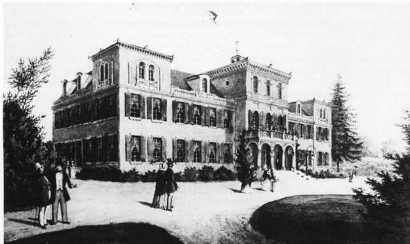
Schloß Fantaisie um 1850