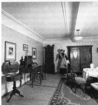
Wohnzimmer um 1900