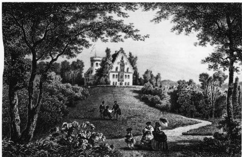
Schloß Rosenau um 1830