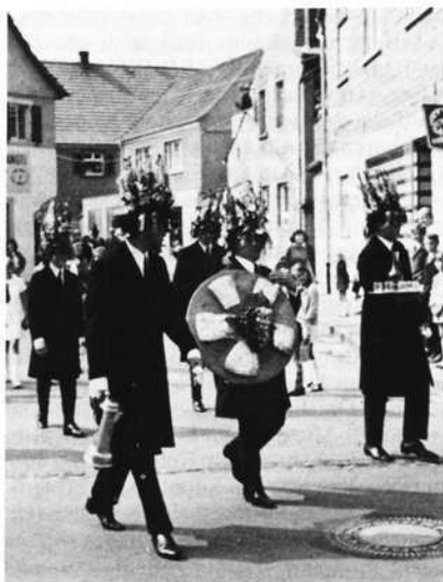
Planburschen mit dem Plankuchen

14. Beim Hutschmuck wäre zu prüfen, ob die Anzahl von 16 Bändern wirklich einer Regel unterliegt oder ob sie zufällig entstand. Beim fünfspitzigen Stern auf dem Brustkreuz der Planburschen handelt es sich um kein Pentagramm im eigentlichen