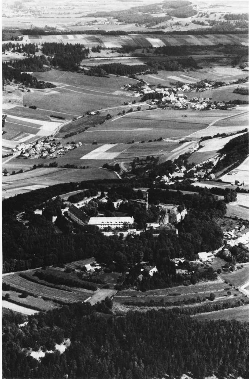
Würzburg, Gesamtansicht inmitten der Territoriallandschaft. Im Hintergrund der Limes.