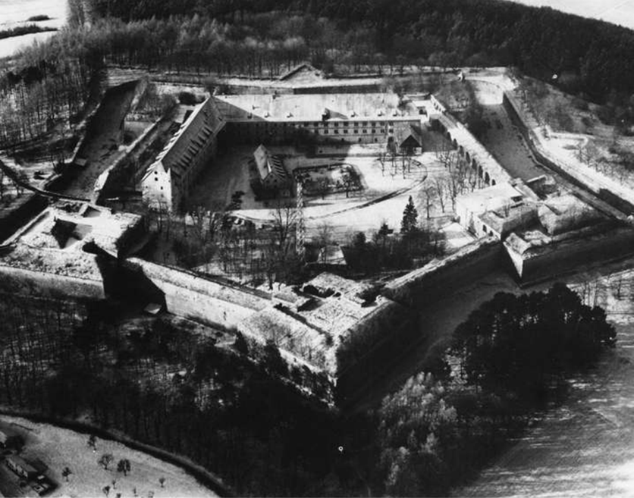
Wülzburg, Gesamtansicht der Zitadelle aus der Vogelschau mit Schloß, Eckbastionen und Grabenverlauf.

Freigegeben durch die Reg. von Obb.: Nr. GS 300/0340-85 Archiv-Nr. 6932/016; SW 4184-21