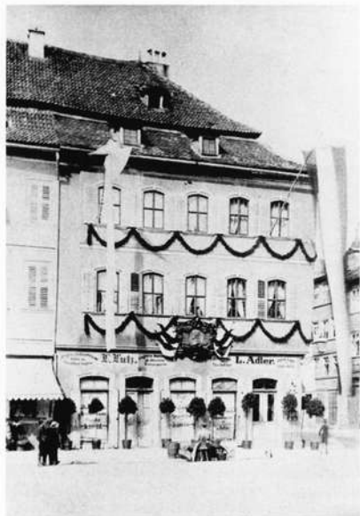
Rückerts Geburtshaus in Schweinfurt anlässlich der Einweihung des Rückert-Denkmal im Oktober 1890.