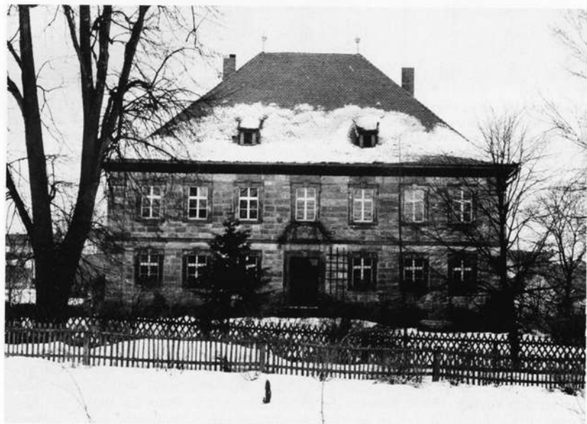
Das in Haig (Gde. Stockheim, Lkrs. Kronach) stehende adelige Landschloß ist – wie jetzt festgestellt wurde – nach einem Plan Balthasar Neumanns entstanden

Der Landkreis Kronach, aus dem die Literatur den Turm der Kirche Mariä Geburt zu Glosberg und einen Erweiterungsbau der Kronacher Festung Rosenberg dem berühmten Barockbaumeister zuschreibt, konnte zum Balthasar-Neumann-Jahr 1987 mit einer kleinen Sensation aufwarten: Zum Auftakt seiner Veranstaltungsreihe zum Gedenken an den großen Schöpfergeist der Barockarchitektur wurde ein der