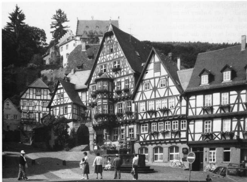
Historischer Marktplatz (Schnatterloch)