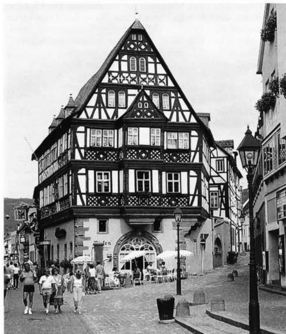
Der "Riesenberg", älteste Fürstenherberge Deutschlands