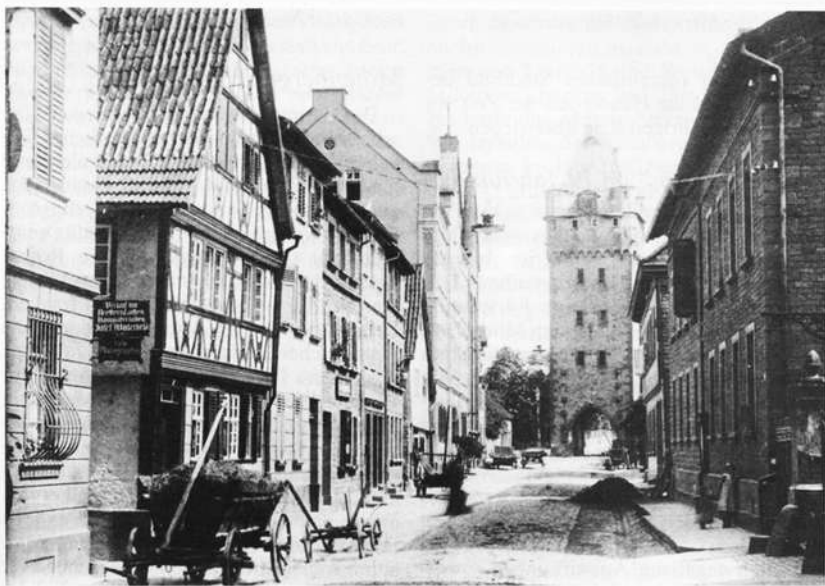
Würzburger Tor und Hauptstraße um 1910

hatten sich die Fuhrleute mehr auf die Route über den Spessart verlegt und wollten nun nicht mehr davon abgehen, da eine Zeitersparnis von einem Tag mit dem neuen Weg verbunden war. Der Handel von und nach Nürnberg erreichte auch nie mehr den Stand des 16. und frühen 17. Jahrhunderts. Nürnberg hatte Handelspartner verloren. Der aufkommende Merkantilismus schuf neue Handelshindernisse. Die zunehmende Bedeutung der Kolonien und der damit verknüpfte Aufstieg Englands und der Niederlande führte zur Verschiebung der wirtschaftlichen Gewichte an die Küste. Die ganze Geschichte zeigt sich noch heute im Stadtbild. Im Vergleich zum reich ornamentierten Fachwerk des 16. und frühen 17. Jahrhunderts, sind die nachfolgenden Fachwerkbauten von großer Schlichtheit. Es fehlte eben an Geld. Nur wenige konnten sich typische Barockbauten aus Stein erlauben. Jedoch hat uns die Geldknappheit der Miltenberger Bürger des 18. und 19. Jahr-