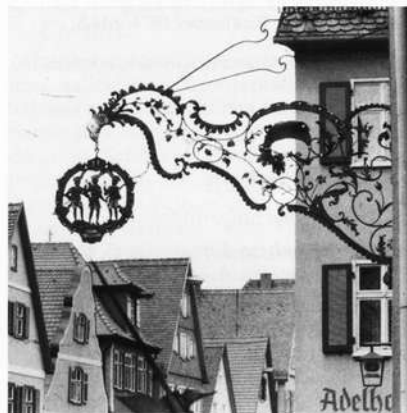
Rokoko-Ausleger in Dinkelsbühl, Lkr. Ansbach

Beispiele dafür finden wir in Sommerach "Zum Schwanen" (Lkr. Kitzingen), in Untersteinbach "Zum Hirschen" (Lkr. Bamberg) und zahlreichen anderen Ortschaften Frankens.